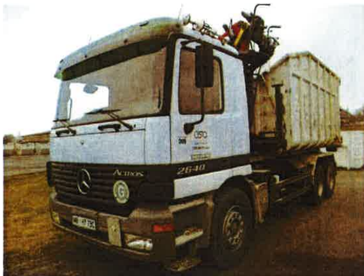
Fotografija 17: Vozilo za prevoz kotalnih prekucnikov

Za prevzemanje in prevoz kosovnih odpadkov uporabljamo kontejnerska vozila ter vozila za prevoz kotalnih prekucnikov.