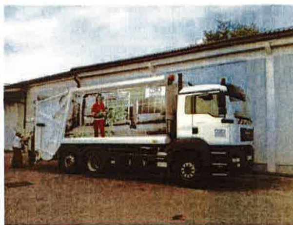
Fotografija 12 in 13: Smetarska vozila