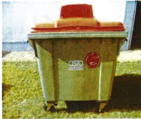
Fotografija 5 in 6: Posode za zbiranje papirja

Za zbiranje plastične embalaže ter ločenih frakcij iz plastike bomo uporabljali: