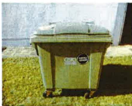
Fotografija 2 In 3: Posode za mešane komunalne odpadke