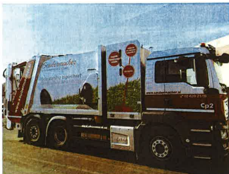
Fotografija 19: Vozilo za pranje zabojnikov za zbiranje bioloških odpadkov