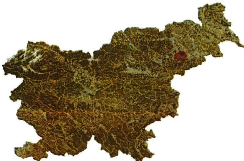
Slika 2: Lega občine Kidričevo