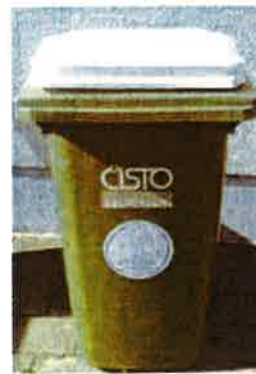
Fotografija 8 in 9: Posode za zbiranje stekla (steklene embalaže)