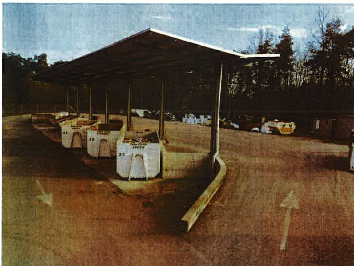
Fotografija 1: Zbirni center Kidričevo

Datumi obratovanja zbirnega centra bodo navedeni na koledarju odvoza odpadkov ter na spletni strani https://cistomesto.si/zbirni-centri/ .