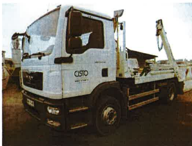
Fotografija 14: Vozilo za prevoz kontejnerjev

Za zbiranje in prevoz odpadkov iz zbirnih centrov, uporabljamo specialna komunalna vozila za odvoz kontejnerjev večjega volumna: