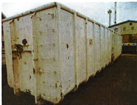
Fotografija 10 in 11: Kovinski kontejnerji