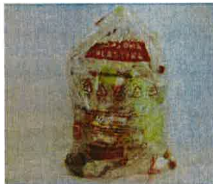
Fotografija 7: Vrečka za mešano embalažo

Za zbiranje steklene embalaže, uporabljamo plastične zabojnike, volumnov 240 l in 1100 l in sicer: