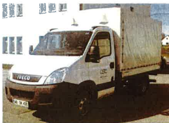
Fotografija 18: Vozila za prevoz in zbiranje nevarnih odpadkov

Za zbiranje in prevoz nevarnih frakcij uporabljamo specialna vozila, s pokritim kesonom in dovoljenjem za prevoz nevarnih snovi.