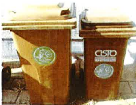
Fotografija 4: Posode za biološke odpadke