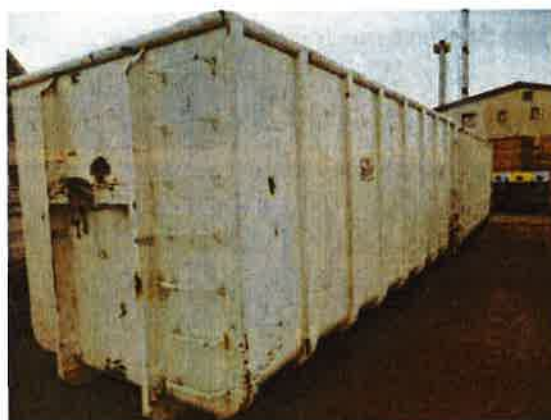
Fotografija 15 in 16: Kontejnerji različnih volumnov za zbiranje kosovnih in drugih odpadkov