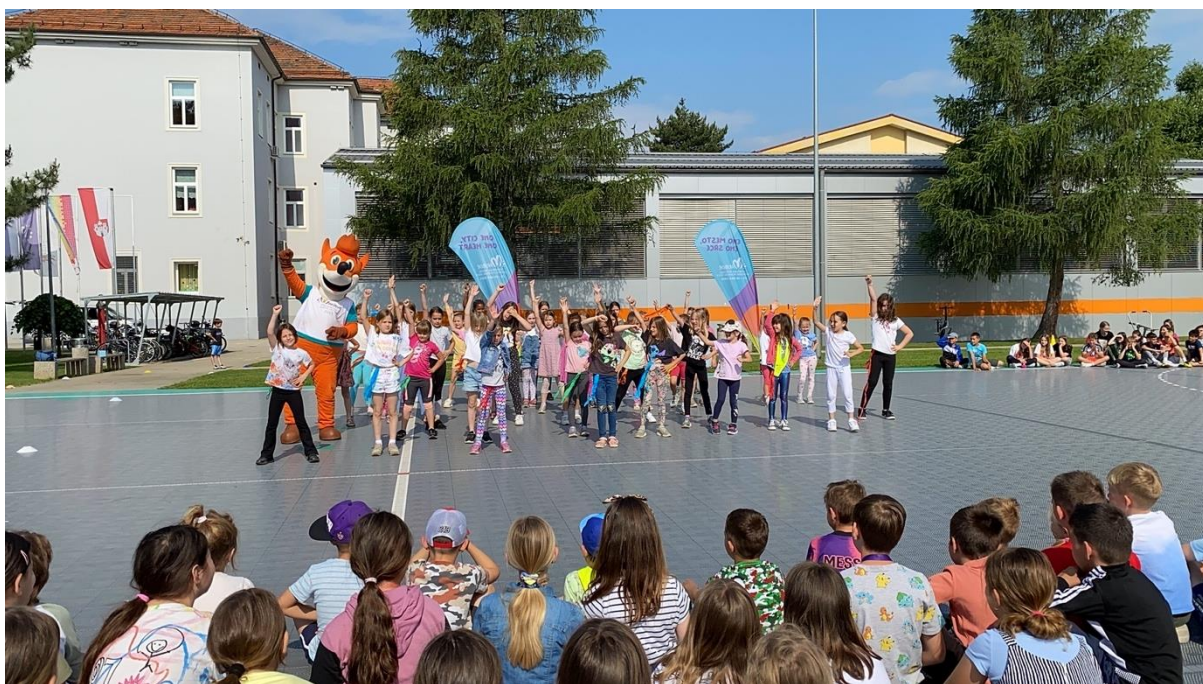
Slika 80: Ples na Osnovni šoli Toneta Čufarja