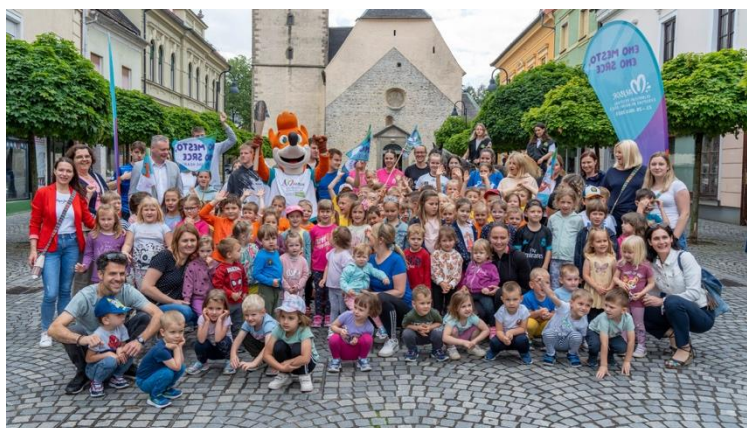
Slika 57: Udeleženci Slovenj Gradec