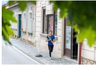
Slika 47: Nosilec bakle miru