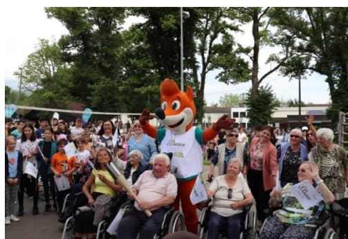
Slika 34: Simbolični krog bakle v rokah SeneCura Hoče