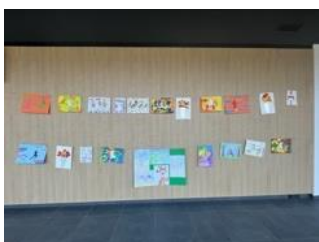
Slika 103: Razstavljene izdelke 1

Po predstavitvi projekta OFEM Maribor 2023 in zadevnih promocijskih dogodkov na kolegiju ravnateljic osmih vrtcev so vse napovedale sodelovanje z likovnimi izdelki. Prejeli smo likovne izdelke sedmih vrtcev, in sicer zelo zanimivih risbic s športnimi junaki, ročno izdelane bakle miru, prave kreacije iz kartona, kot npr. nogometno in košarkarsko igrišče, imitacijo rož v loncu na temo olimpizma, nogometno kopačko in kaširano rokometno žogo. Organizator OFEM je izdelke razstavil v prostorih pisarne OFEM v Ljudskem vrtu, v sejni sobi, v kiosku na ulici Maksimilijana Držečnika in v Dvorani Tabor.