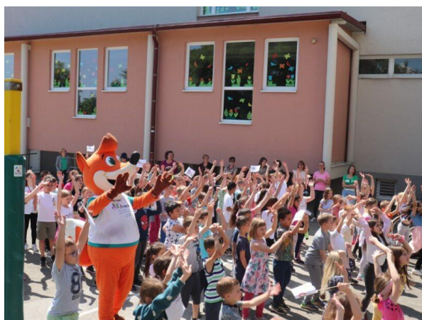
Slika 95: Plesni gibi na himno

Predzadnja postaja potovanja bakle miru po osnovnih šolah je bila šola Maksa Durjave. Na športnem igrišču pred šolo se je zbrala prva triada. Moderatorka OFEM 2023 je vse uvodoma pozdravila, nato so mladi udeleženci s pomočjo ekipe OFEM sledili plesnim gibom, tako da je vse potekalo brezhibno. Sledili so teki, kjer sta po dva učenca nosila baklo miru v predvidenih krogih. Sledilo je še fotografiranje vseh prisotnih s plakatom, ki ga je šola pripravila za organizatorje OFEM.