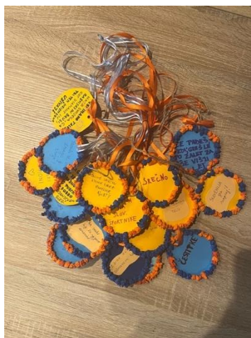
Slika 102: Ročno izdelane medalje (Dom Danice Vogrinec Maribor)

Na povabilo k sodelovanju sta se odzvala dva domova, Dom Danice Vogrinec in Dom pod Gorco. Pri obeh smo izvedli tematsko delavnico, ki je bila izvedena po istem programu, najprej smo starostnikom predstavili kviz o olimpizmu, nato je sledil športni del s telovadbo, prilagojeno starostnikom, in druženje zaključili z učenjem koreografije in s plesom na himno festivala. V obeh domovih so starostniki pripravili likovne izdelke. Dom pod Gorco je organizatorju OFEM predal dva plakata. Iz Doma Danice Vogrinec je ekipa OFEM odšla z zelo lepo izkušnjo in ročno izdelanimi medaljami, na katerih so bile zapisane motivacijske misli za tekmovalce. SeneCura Dom starejših občanov Hoče - Slivnica je sodeloval v času potovanja bakle miru v Občino Hoče-Slivnica. Prišlo je več kot 20 oseb, nekateri so sodelovali s pomočjo opore ali na invalidskih vozičkih. Opravili so simbolični krog okoli igrišča za odbojko.