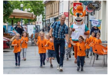
Slika 48: Simbolični krog najmlajših