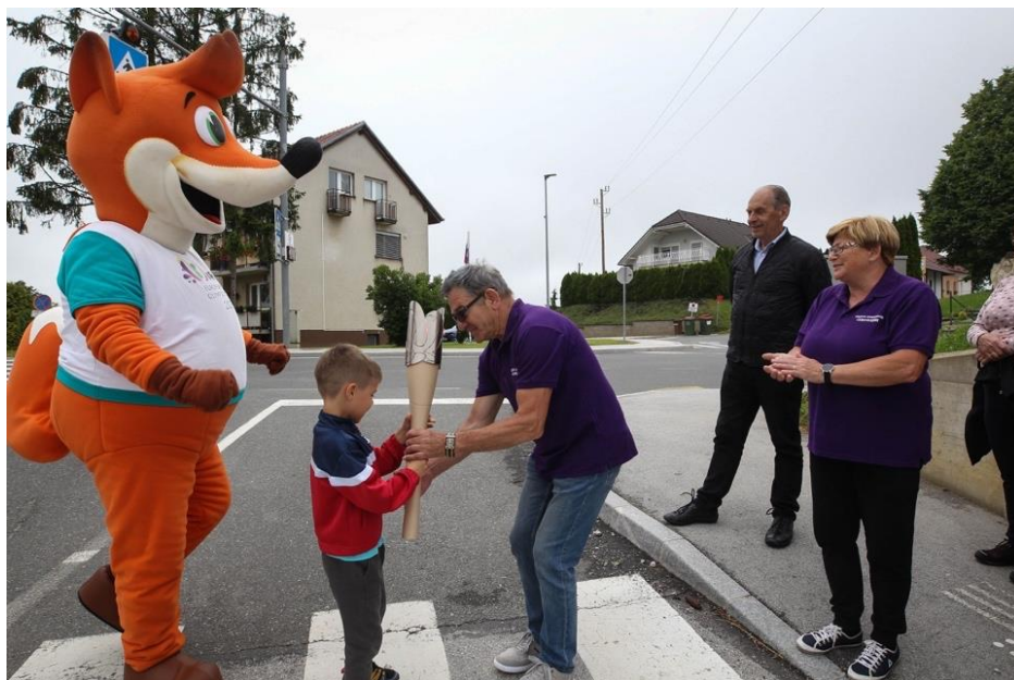
Slika 10: Večgeneracijska predaja bakle miru v Šentilju

Bakla miru je drugi dan začela potovanje v občini Cerkvenjak. Zbor prisotnih je bil pred občinsko stavbo, sledili so govori povezovalke, župana in ravnatelja osnovne šole. Nato so baklo miru od lisjaka Foksija prevzeli otroci vrtca Pikapolonica, ki so bili prvi nosilci. Na naslednji predaji so jih pričakali člani Društva upokoencev Cerkvenja, baklo odnesli do šolskega igrišča, kjer so jo predali učencem Osnovne šole Cerkvenjak – Vitomarci, ki so odtekli par krogov okoli igrišča.