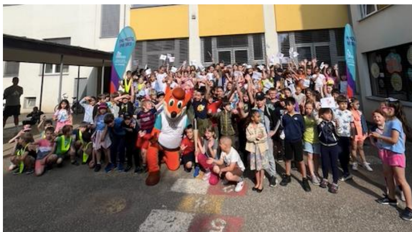
Slika 63: Osnovna šola Prežihovega Voranca

Prvi dan je bakla miru potovala v štiri osnovne šole. Že začetek potovanja bakle v Osnovni šoli Prežihovega Voranca je bil fantastičen. Baklo je namreč pričakalo zelo veliko otrok, ki so že pred prihodom vadili koreografijo na himno festivala. Na odru pred šolo so se zbrali najmlajši učenci in pripravili sprejem za prvi obisk bakle miru. V uvodu je vse prisotne nagovorila ravnateljica, po prihodu Foksija z baklo in plesu na koreografijo OFEM pa so predstavniki odtekli več krogov po šolskem igrišču. Pripravili so izjemno kuliso, saj so namesto predvidenih tekačev prav vsi prisotni tekli za baklo miru. Po skupnem fotografiranju in predaji izdelkov je ekipa OFEM z baklo miru odšla na naslednjo šolo.