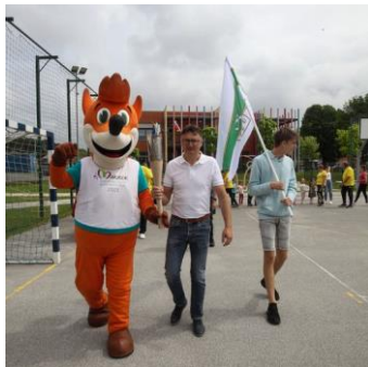
Slika 16: Prihod bakle in župana v cilj