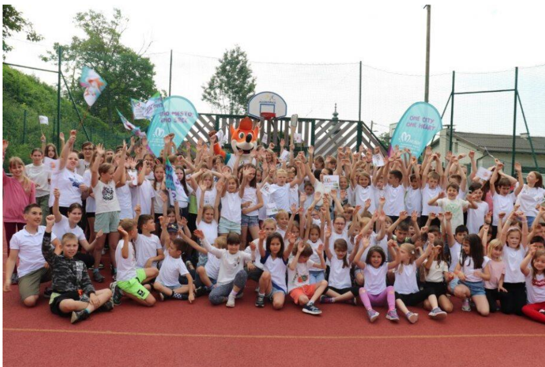
Slika 79: Poslovilna fotografija iz Osnovne šole Malečnik