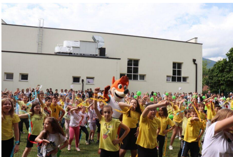
Slika 72: Ples na himno festivala v stilu flash mob