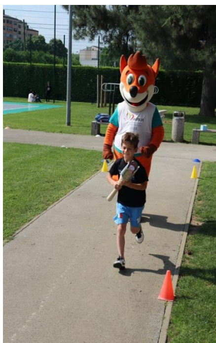
Slika 81: Hiter tek