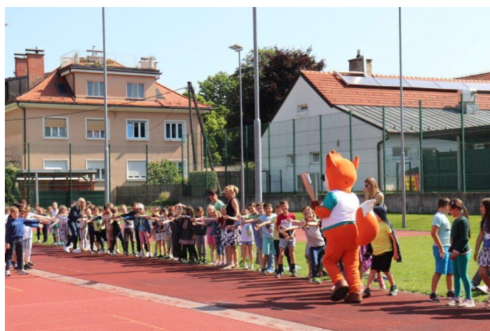
Slika 91: Prvi krog je odtekel Foksi

Drugi gostitelji bakle miru so bili tega dne osnovnošolci šole Franca Rozmana Staneta. Nekaj besed o olimpizmu, združevanju in pomembnosti sodelovanja je vsem prisotnim namenila ravnateljica šole. Nadalje so otroci pokazali plesne veščine na koreografijo OFEM, sledil je še en ples, kjer so se aktivno vključili tudi tisti, ki so se na licu mesta naučili plesne koreografije. Prvi krog je odtekel lisjak Foksi, ki je baklo nato predal osnovnošolcem, ki so odtekli par krogov. Za zaključek je šola Foksiju predala še štiri plakate na temo OFEM.