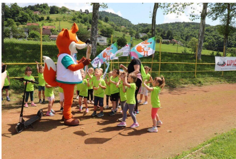
Slika 40: Nadušenje ob prihodu bakle miru in Foksija