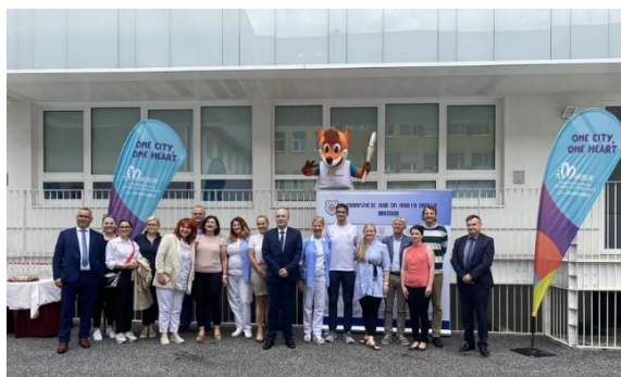
Slika 107: Zavod Adolfa Drolca Maribor

Z namenom promocije dogodka in v zahvalo smo obiskali 21 partnerjev, sponzorjev in JHMB.