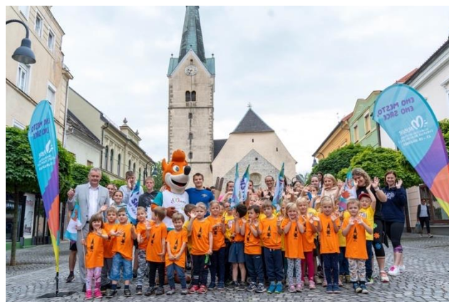
Slika 56: Spominska fotografija najmlajših