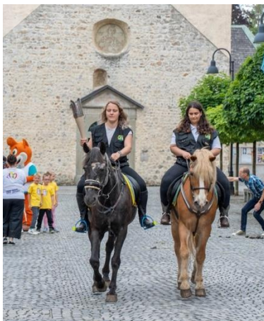
Slika 53: Konjenici in bakla miru