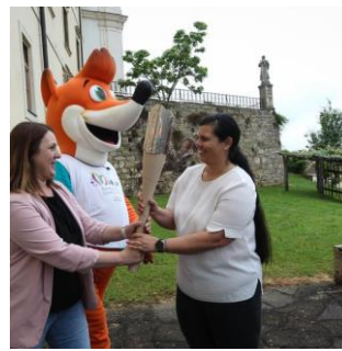
Slika 13: Predaja bakle miru med uslužbenci