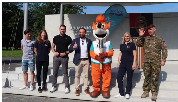
Slika 108: OFEM delegacija na obisku pri Slovenski vojski