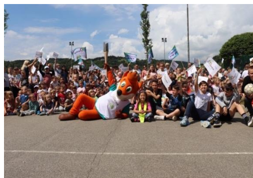
Slika 36: Občina Hoče-Slivnica