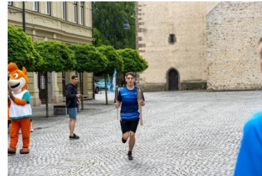
Slika 51: Zadnji metri pred predajo