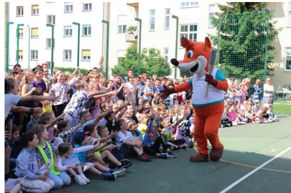
Slika 66: Pozdrav lisjaka Foksija in bakle miru