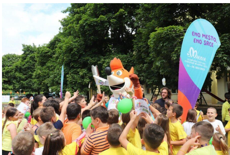
Slika 73: Navdušenje pri prihodu uradne maskote in bakle miru