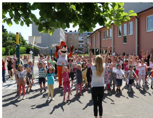
Slika 96: Pomoč ob plesni koreografiji