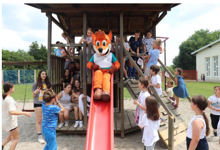
Slika 87: Nagajivo razpoložen lisjak Foksi