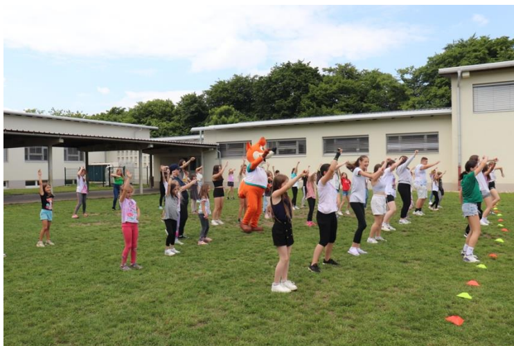
Slika 86: Ples osnovnošolcev na Teznu