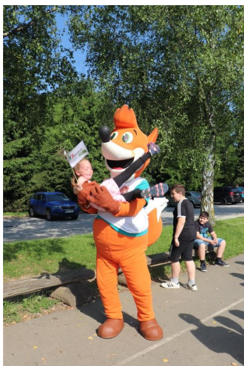
Slika 89: Super ples Foksija z učenko v naročju