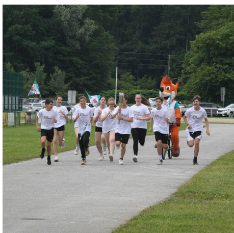
Slika 20: Pot bakle miru po ŠRC Polena