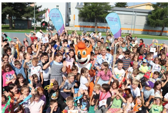
Slika 82: Pomahajmo bakli miru