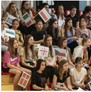
Slika 22: Zastave vseh udeleženk