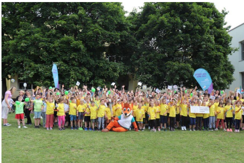
Slika 74: Zaključna fotografija na OŠ Leona Štuklja