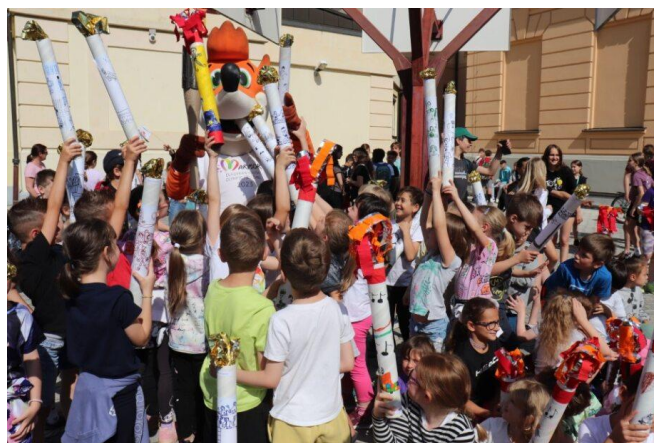
Slika 64: Osnovna šola Bojana Iliča in ročno izdelane bakle miru

V šoli Bojana Iliča je baklo miru pričakalo okoli 500 osnovnošolskih otrok in vsi učitelji na šoli, ki jih je nagovorila ravnateljica šole. Pripravili so veliko ročno izdelanih bakel. Nosilci bakle so naredili živi krog na dvorišču šole in si med seboj podajali baklo miru.