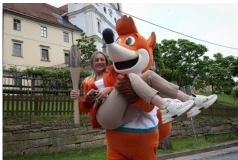
Slika 12: Rajanje v Sveti Trojici v Slovenskih Goricah

Bakla je svoje potovanje nadaljevala v bližnjo občino Sveta Trojica v Slovenskih Goricah. Baklo miru so pričakali zaposleni pred občino. Prva nosilka je baklo miru s trga odnesla na grič, do cerkve Svete trojice. Ob izjemni kulisi so se prisotnim pridružili osnovnošolci, ki so pritekli iz bližnje osnovne šole, ko so skozi okno opazili, da se nekaj dogaja v bližini. Prisotni so naredili živi krog in bakla miru je tudi po tej občini šla od rok do rok. Sledila je še degustacija izjemne gibanice in bakla miru je nadaljevala svojo pot.