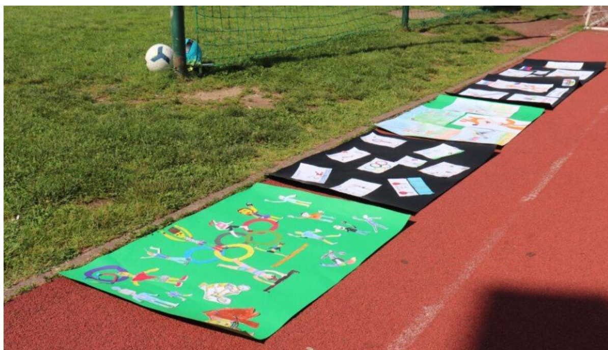
Slika 92: Štirje plakati na temo olimpizma