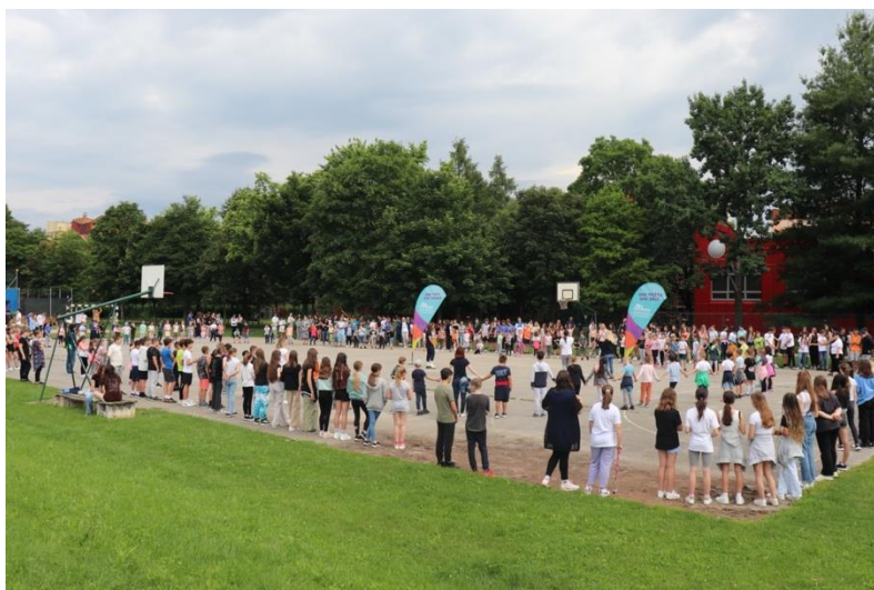
Slika 70: Dva živa kroga, ki so ju pripravili na OŠ Tabor I

Druga postaja drugega dne je bila Osnovna šola Tabor I. Gruča osnovnošolcev, ki so se pripravljali na prizorišču, je dala slutiti, da bo prisotna celotna šola. Pripravili so dva živa kroga. V notranjem so se zbrali najmlajši, ki so kasneje tudi zaplesali na himno, medtem ko so zunanji krog pripravili starejši osnovnošolci. Slednji so si tudi podajali baklo iz rok v roke.