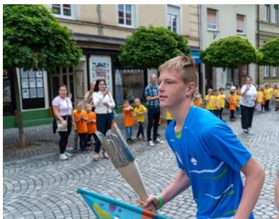
Slika 52: Start z baklo