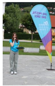
Slika 43: Osnovnošolska moderatorka