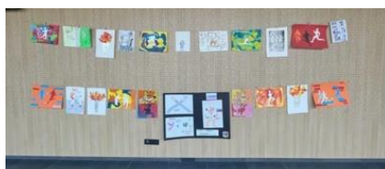
Slika 104: Razstavljene izdelke 2