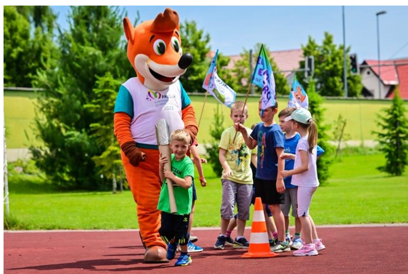
Slika 85: Pri predajah bakle miru je pomagal Foksi