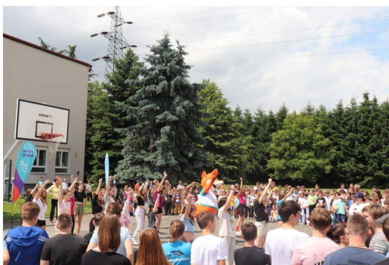
Slika 75: Ples Foksija in osnovnošolcev OŠ Ludvika Pliberška

Predzadnja sredina lokacija je bila Osnovna šola Ludvika Pliberška. Najprej je prisotne nagovorila ravnateljica, sledil je ples in nato slavnostni prihod bakle miru s Foksijem, ki je pomagal odplesati na himno. Sam je tudi odtekel prvi simbolični krog z baklo miru. Številni prisotni so se ga zelo razveselili in si nato po vrstnem redu od najvišjih do najnižjih razredov predajali baklo.