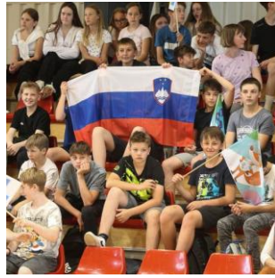
Slika 23: Navijači