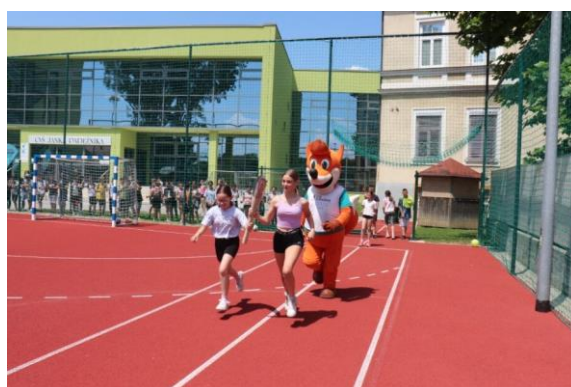
Slika 100: Hiter krog z baklo miru v sodelovanju učenk