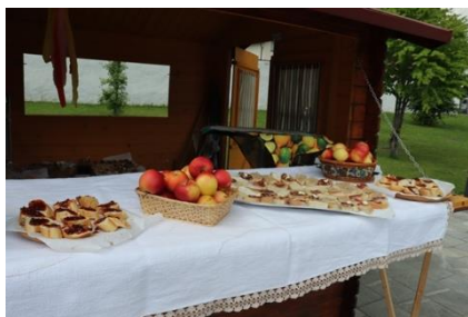
Slika 42: Pogostitev občinskih društev