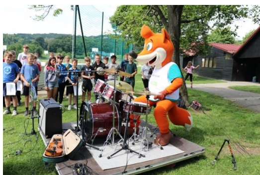
Slika 33: Foksi na glasbenih bobnih