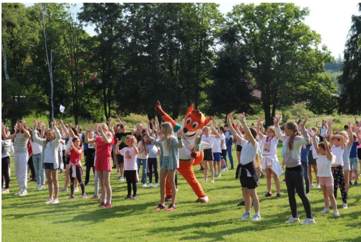
Slika 88: Ples na himno festivala celotne šole Kamnica