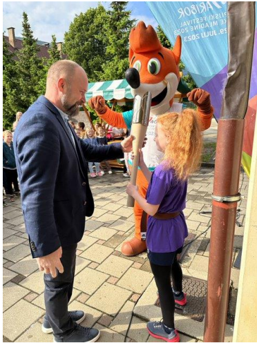
Slika 26: Predaja bakle