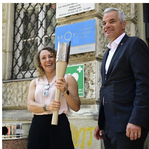
Slika 5: Prva predaja bakle miru