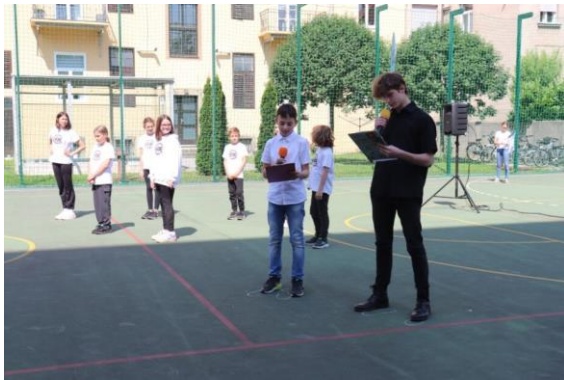
Slika 65: Generalka na OŠ Bratov Polančičev