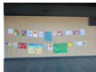
Slika 105: Razstavljene izdelke 3