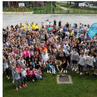
Slika 17: Skupna fotografija za spomin