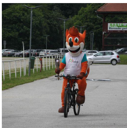
Slika 18: Prihod Foksija in bakle miru na kolesu