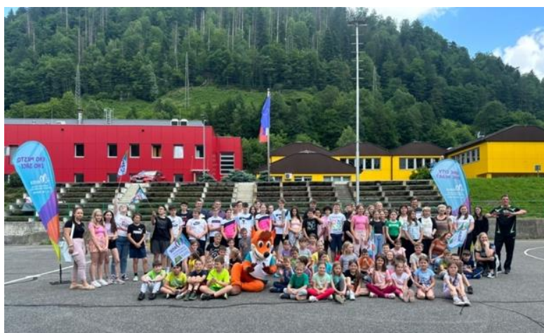
Slika 62: Pozdravi iz občine Podvelka

Zadnja obiskana občina je bila Občina Podvelka. Mladi in nadobudni športniki so si razdelili dele poti in si predajali baklo. Pot se je zaključila s skupno fotografijo za spomin.