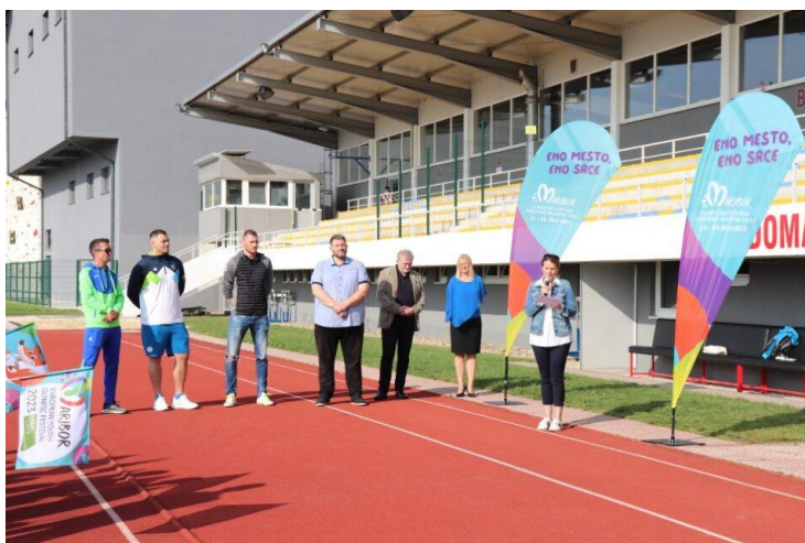
Slika 31: Znani športniki, župan in direktorica OFEM-a v Slovenski Bistrici