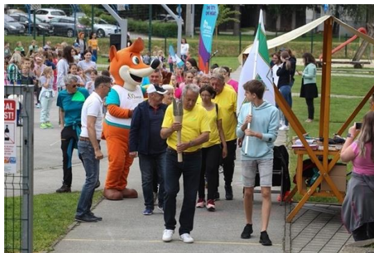
Slika 15: Prvi nosilec bakle miru