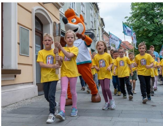
Slika 55: Krog bakle s skupnimi močmi