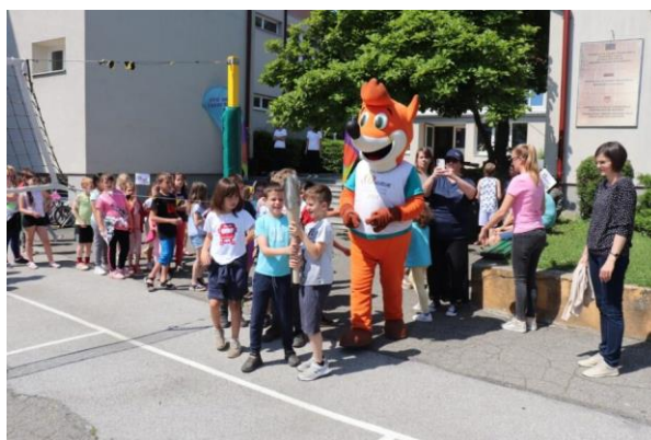
Slika 97: Pazljivo držanje bakle miru