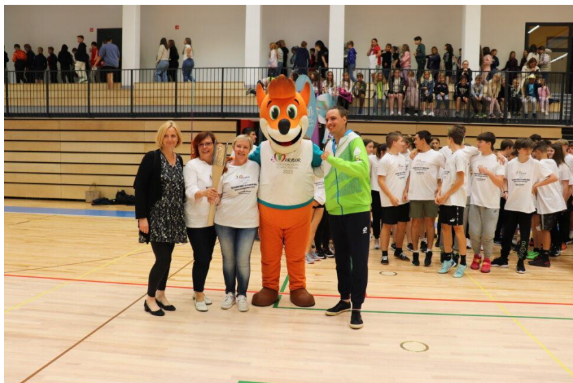
Slika 8: Zbrana ekipa govorcev v občini Šentilj