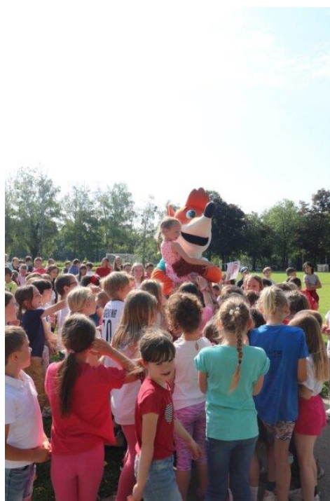
Slika 90: Množica otrok okoli Foksija in bakle