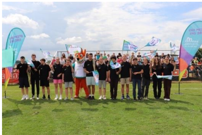
Slika 37: Nosilci bakle iz občine Miklavž na Dr. polju