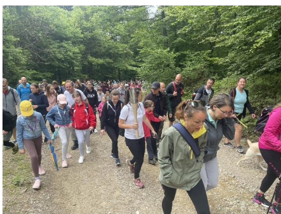
Slika 7: Pohod bakle na Pohorje

Pohoda se je udeležilo izredno veliko število pohodnikov, tako mladih kot starejših, ki so skupaj s Foksijem ponesli baklo miru mimo Trikotne jase, Koče Luka in vse do vrha Pohorja, do zgornje postaje gondole Bellevue, ter širili olimpijski duh. Dogodek je bil uspešen, dosegel je svoj promocijski namen, predvsem pa namen ozaveščanja udeležencev o zdravem življenjskem slogu ter spoštovanju olimpijskih vrednot – prijateljstva, povezovanja in spoštovanja. Na dogodku je udeležence povezovala dobra volja, pozitivna energija in ob prehajanju bakle iz rok v roke so prenašali tudi sporočilo miru, enotnosti ter zavedanja, da so del nečesa velikega.