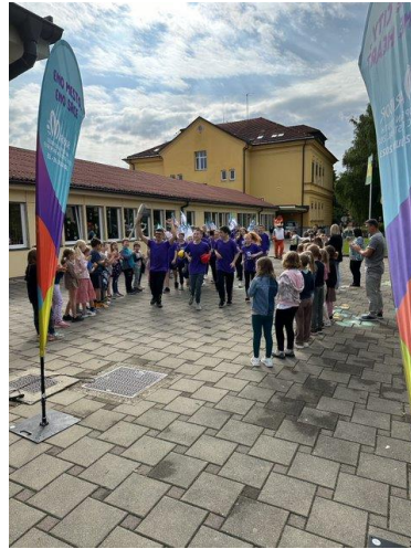
Slika 27: Špalir ob prihodu v cilj