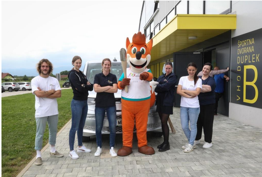
Slika 3: Terenska ekipa potovanja bakle miru OFEM 2023 Maribor

Ekipa je ažurno skrbela za ves promocijski material (fotografije, video, plakate itd.), ga posredovala v organizacijsko pisarno oz. na Google Drive, Dropbox in SharePoint. Oseba, ki je skrbela za promocijo in objave na spletnih omrežjih (Instagram, Facebook in spletna stran), je nato dnevno objavljala in ozaveščala javnost, najprej napovedala dogodek na lokacijah, ki jih bo ekipa z baklo miru obiskala in nato poročala o aktivnostih, ki so bile na sporedu.