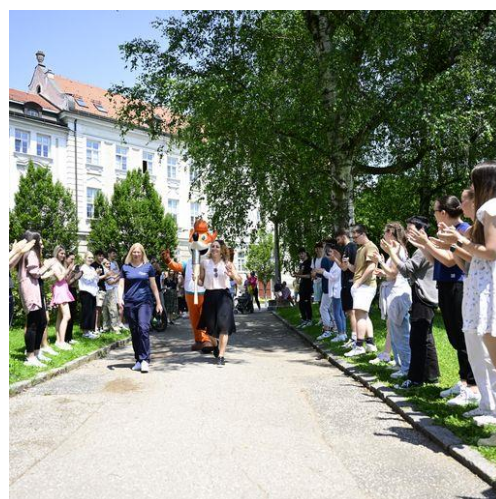
Slika 6: Sprehod bakle miru po Mestni občini Maribor