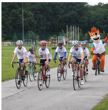
Slika 21: Predajo so opravili tudi kolesarji