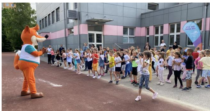
Slika 69: Ples najmlajših na himno festivala

Začeli smo v Osnovni šoli Angela Besednjaka v Mariboru. Ravnateljica je uvodno besedo namenila pomenu prihoda bakle, ki jo je nato prinesel lisjak Foksi. S pomočjo vseh otrok je zaplesal na himno festivala. Zbrani so odteкли tudi simbolični krog in si na točkah v krogu predajali baklo.