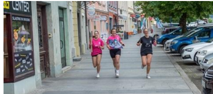
Slika 50: Nosilke bakle