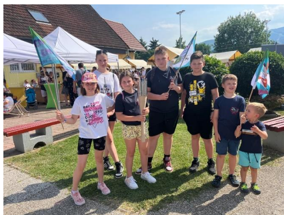
Slika 106: Svetovni dan beguncev in bakla miru