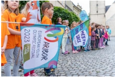
Slika 46: Špalir vrtčevskih otrok