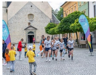
Slika 54: Predaja in start nove skupine