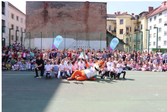
Slika 67: Spominska fotografija