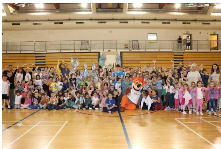
Slika 7: Bakla miru v občini Kungota