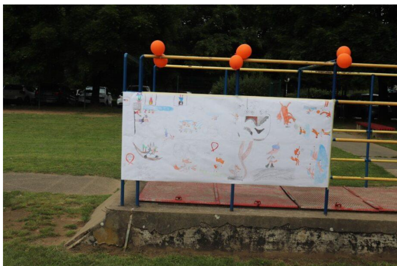
Slika 71: Rastavljeni likovni izdelki