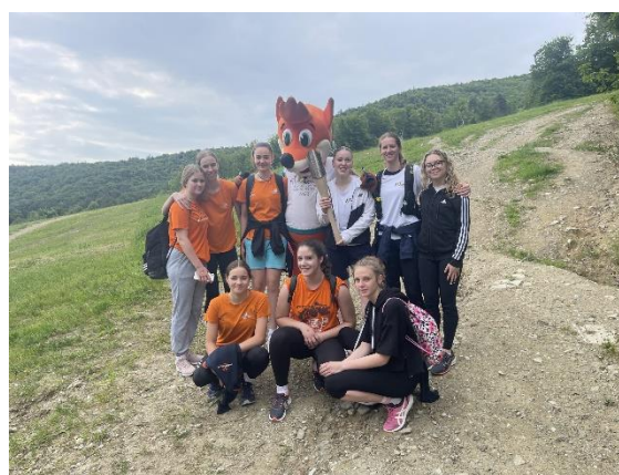
Slika 8: Pohod bakle na Pohorje