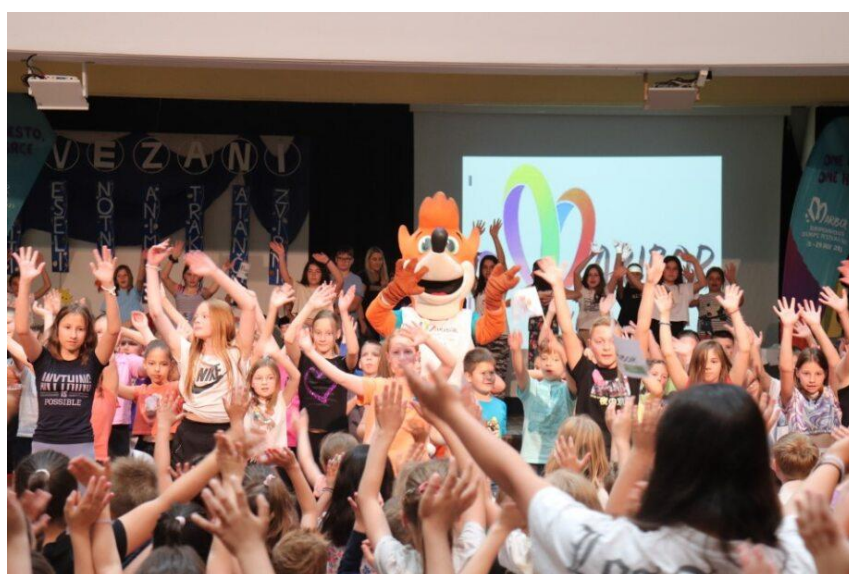
Slika 83: Rajanje otrok pri prihodu bakle miru

Na Osnovni šoli borcev za severno mejo je prihod bakle miru potekal na dan, ko so organizirali razstavo izdelkov in imeli šolsko prireditev podeljevanja priznanj. Šolska prireditev je potekala v prostorih šole, kjer so otroci pričakali prihod bakle in delegacijo OFEM. Osnovnošolci so zaplesali na himno s pomočjo lisjaka Foksija, nato so osnovnošolci z baklo miru naredili krog znotraj šole in opravili štiri predaje. Sledilo je rajanje vse prisotnih na uradno koreografijo OFEM z lisjakom Foksijem.