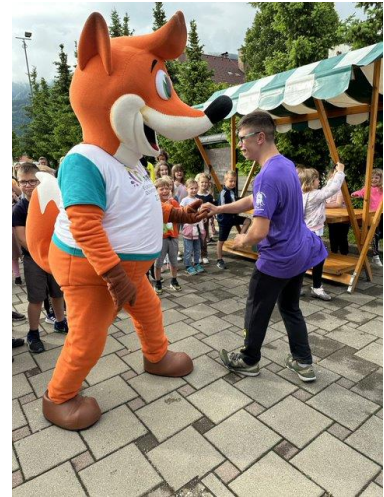
Slika 28: Zabava po protokolarnem delu