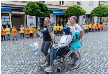
Slika 49: Pot bakle miru