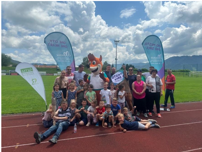
Slika 61: Zaključek v Radljah ob Dravi

V Radljah ob Dravi so se udeleženci zbrali na atletskem stadionu. Najmlajši so baklo pozdravili z zastavicami, medtem ko so jo starejši ponosno nosili po občinskem stadionu.