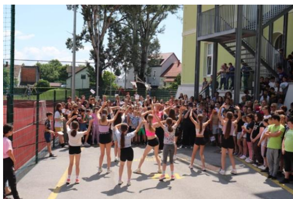
Slika 99: Odlična izvedba plesa na koreografijo

Prisrčno in izjemnemu vremenu primerno druženje se je bližalo koncu, nekateri osnovnošolci so vadili plesno koreografijo, ki so jo spoznali, drugi so nagajali lisjaku Foksiju. Da pa je slednji pravi športnik je pokazal tudi s poznavanjem drugih športnih vragolij. Na koncu je sledila skupna fotografija.