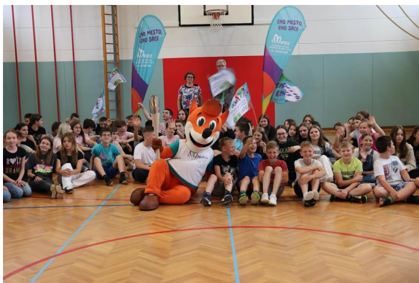
Slika 9: Sveti Jurij v Slovenskih Goricah

Zadnja postaja bakle prvega dne potovanja po občinah je bila Občina Sveti Jurij v Slovenskih Goricah. Zaradi vremenskih razmer je prišlo do reorganizacije prvotnega načrta, in namesto v športnem parku Jurovski dol je dogodek potekal v športni dvorani osnovne šole, kjer so se zbrali osnovnošolski učenci, ravnateljica in župan ter naredili živi krog. Prav vsak osnovnošolec je lahko bil del poti bakle miru po njihovi občini.