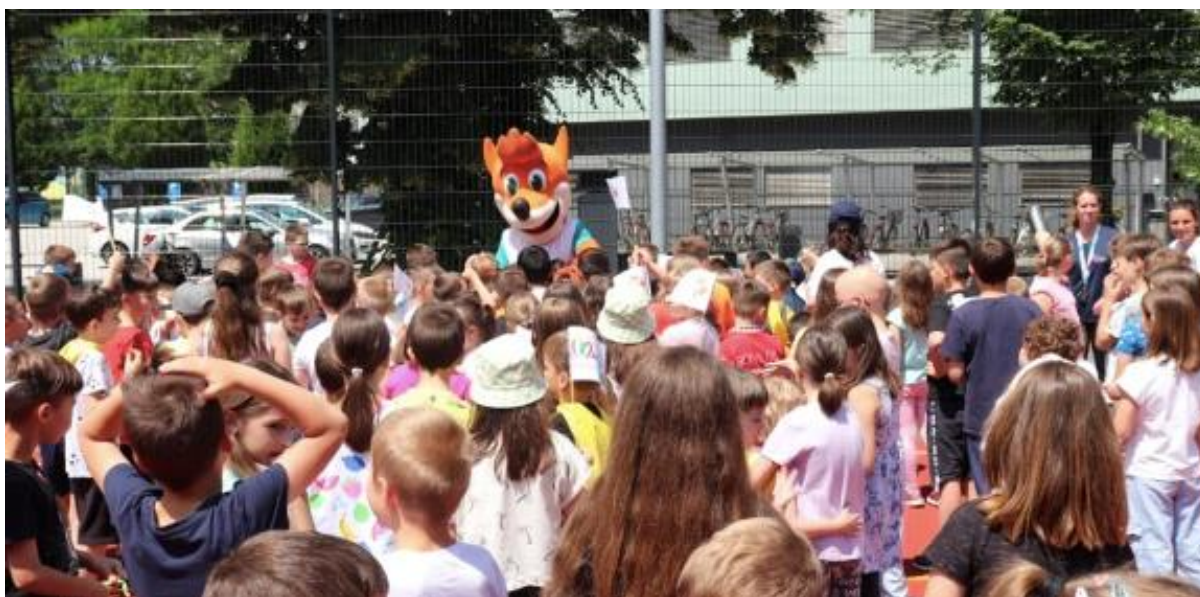
Slika 68: Navdušenje osnovnošolcev ob prihodu bakle miru na OŠ Franceta Prešerna