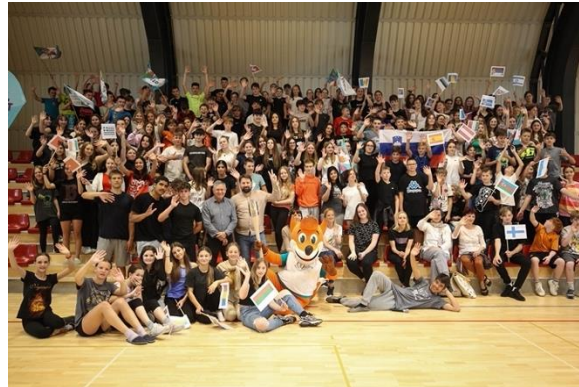
Slika 25: Odlična kulisa, ki so jo pripravili v občini Duplek