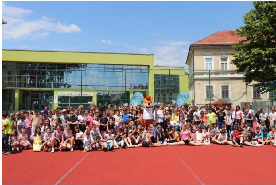
Slika 101: Nasmeh vseh ob zaključku na OŠ