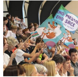
Slika 24: Vihtenje zastav