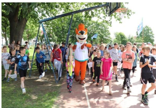
Slika 35: Simbolični krog bakle z osnovnošolci