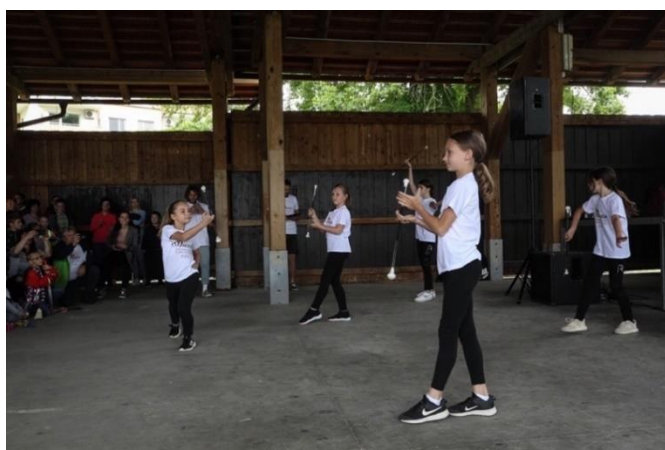
Slika 19: Mažoretke