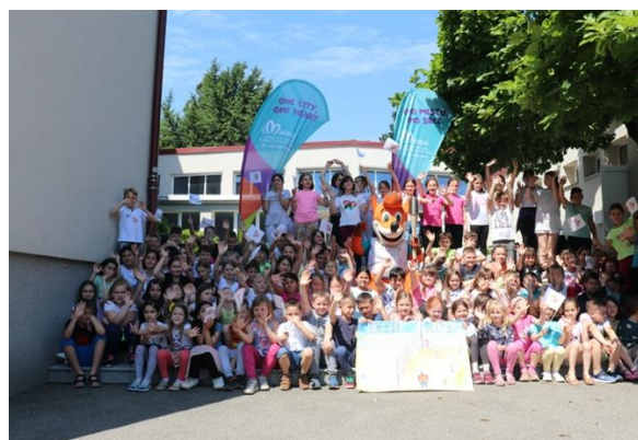
Slika 98: Predaja izdelka in foto za spomin