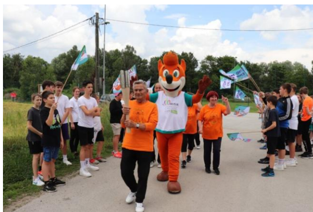
Slika 38: Špalir za baklo miru v občini Starše

Občina Starše je izbrala izvedbo poti od nogometnega igrišča do osnovne šole, kjer so imeli pod streho že vse pripravljeno pred prihodom ekipe OFEM. Po poljski cesti so baklo miru s pomočjo Društva upokojencev, osnovnošolcev in športnega društva ponesev do šole, kjer je imel govor župan. Nagovoril je vse prisotne in poudaril pomen prihoda bakle miru v njihovo občino in njeno simboliko. Vsi prisotni so dobili sladolek, vreme je začelo nagajati in tako se je potovanje bakle za ta dan tudi zaključilo.