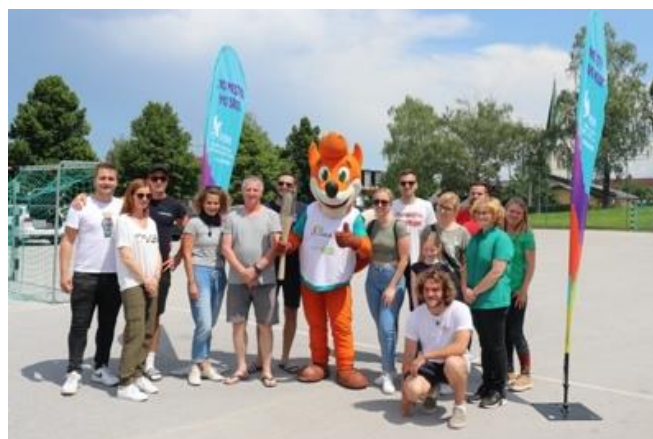
Slika 44: Udeleženci potovanja bakle v Slovenskih Konjicah

V Občini Slovenske Konjice ni bilo ne duha ne sluha o slabem vremenu. Organizatorica dogodka je zbirala udeležence iz Javnega zavoda v občini. Zbrali so se v sklopu rednega letnega turnirja v odbojki na mivki in si v živem krogu predajali baklo miru. Tako je slednja zaključila še svoj predzadnji dan potovanja po občinah.