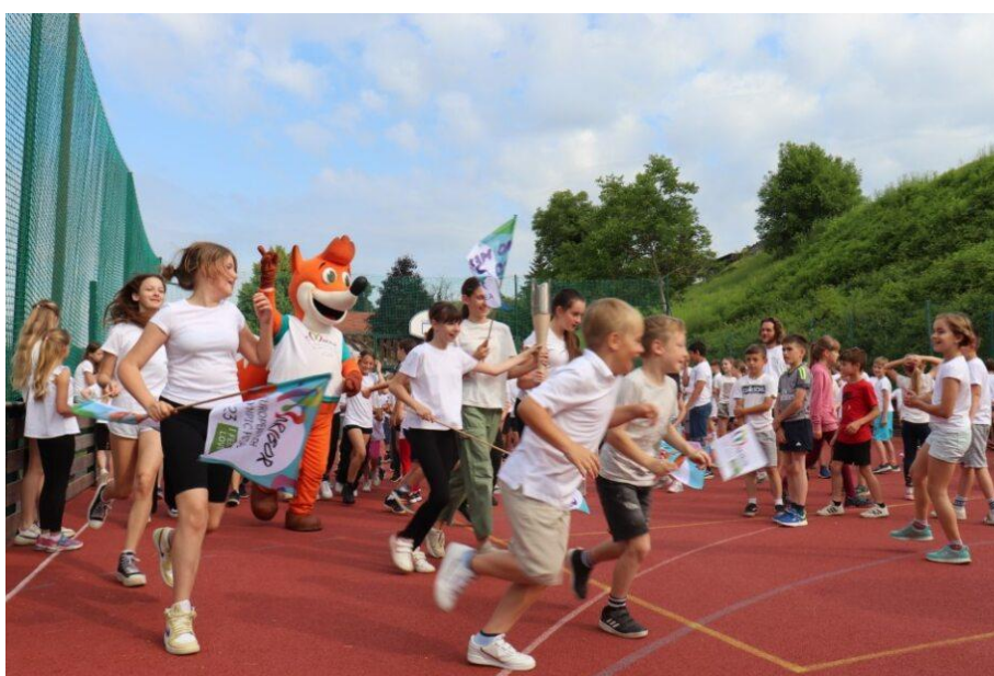
Slika 78: Tek simboličnih krogov z baklo miru, zastavicami OFEM in uradno maskoto Foksijem