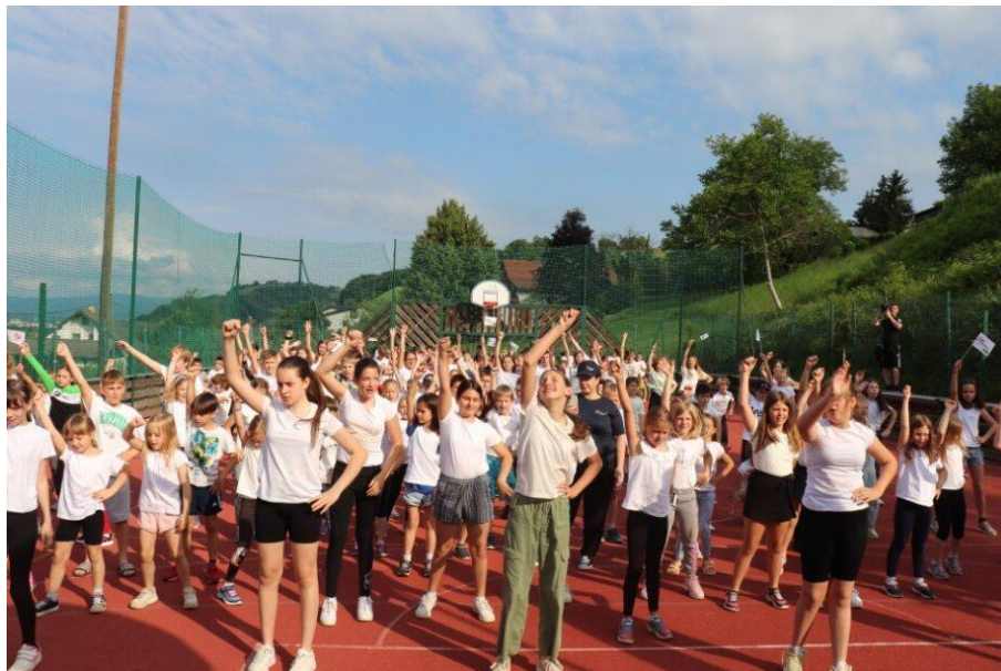
Slika 77: Ples na OFEM himno

Tretji dan popotovanja je bakla miru obiskala pet osnovnih šol. Na poti jo je spremljalo prijetno sončno vreme, tako da so bili temu primerni tudi fotografski kadri. Bakla miru, simbol miru, prijateljstva, strpnosti, upanja, svetlobe in olimpijskih vrednot je ta dan začela potovanje na Osnovni šoli Malečnik. Skupina otrok se je zbrala na majhnem hribčku, kjer imajo zunanje športno igrišče. Baklo je iz rok lisjaka Foksija prevzela ravnateljica, ki je v govoru poudarila pomen sodelovanja in povezovanja vseh v okviru potovanja.