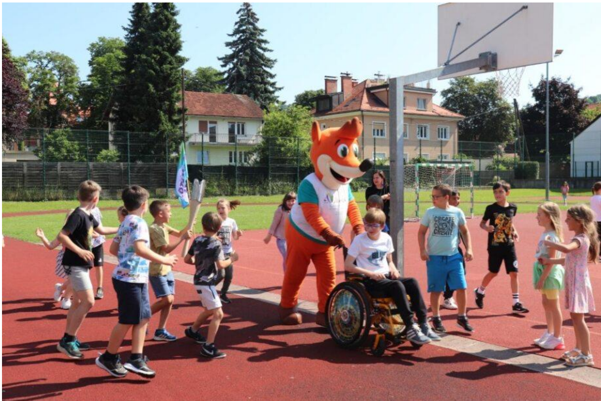
Slika 94: Pri simboličnih krogih z baklo miru je pomagal tudi Foksi