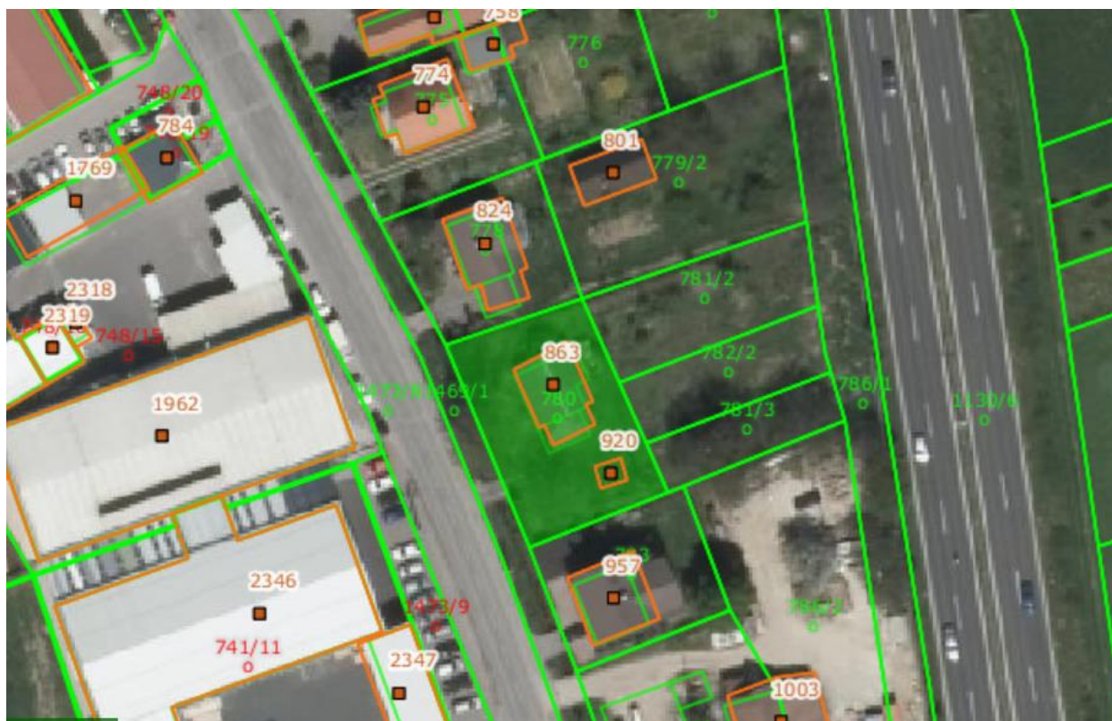
Slika 1: prikaz parcel

Obravnavano območje zajema parcele številka 780, 781/2, 782/2, 781/3, k.o. Spodnje Hoče.