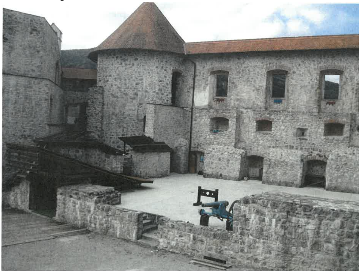
Slika: Dvorišče gradu Žužemberk

Vir: https://commons.wikimedia.org , januar 2017.