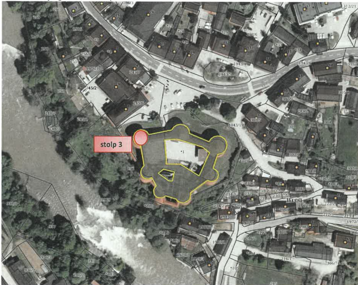
Slika: Lokacija gradu ter stolpa 3