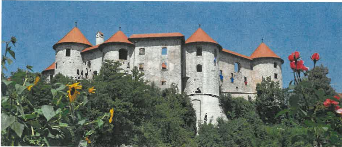
Slika: Grad Žužemberk