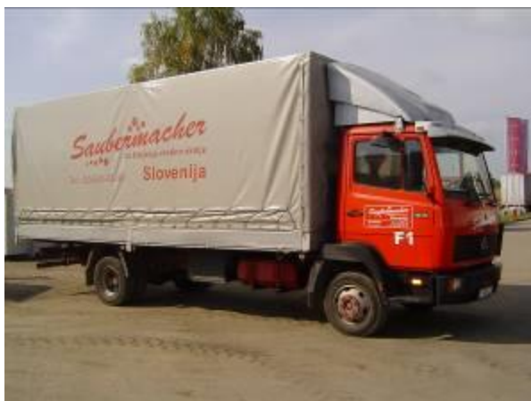
Slika 10: Premična zbiralnica nevarnih frakcij