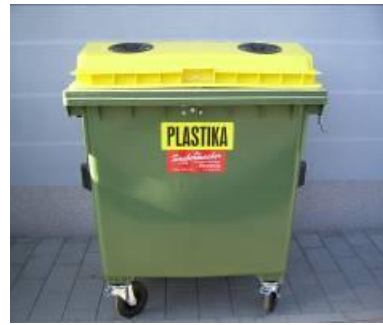
Slika 5: Namenska embalaža za zbiranje plastične, kovinske, sestavljen in mešane embalaže