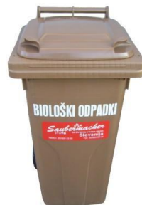
Slika 6: Namenska embalaža za zbiranje biorazgradljivih odpadkov