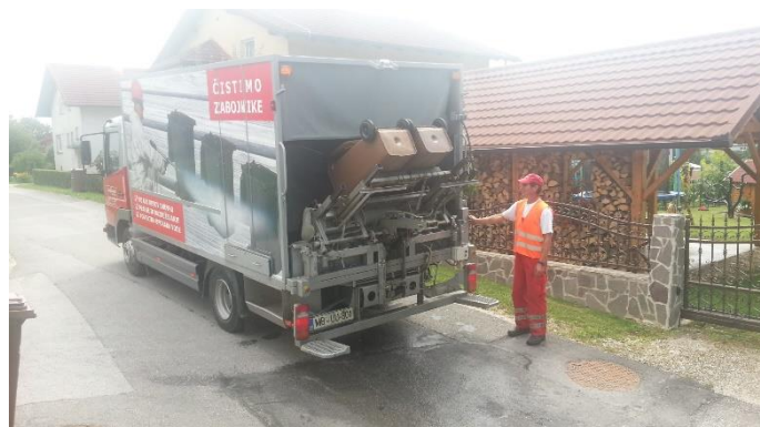
Slika 11: Vozilo za pranje zabojnikov za zbiranje odpadkov