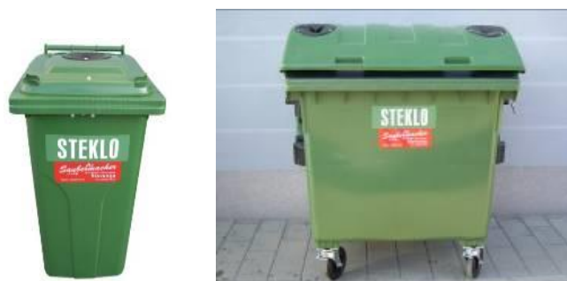
Slika 8: Namenska embalaža za zbiranje steklene embalaže