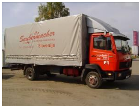
Slika 7: Namenska embalaža in specialno vozilo za zbiranje kosovnih odpadkov