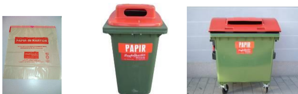
Slika 4: Namenska embalaža za zbiranje papirja in papirne embalaže