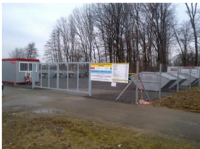
Slika 9: Zbirni center ločenih frakcij Radenci

Zbirni center ločenih frakcij se nahaja v naselju Boračeva, na lokaciji pri stari žagi, parc. št. 55/3 in 55/5, k.o. Boračeva.