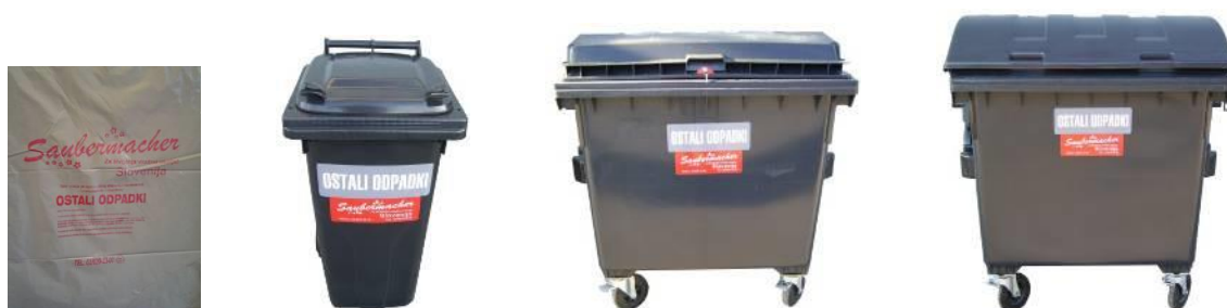
Slika 3: Namenska embalaža za zbiranje mešanih komunalnih odpadkov