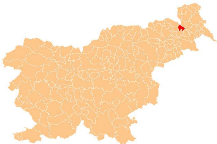
Slika 2: Lega Občine Radenci v Republiki Sloveniji