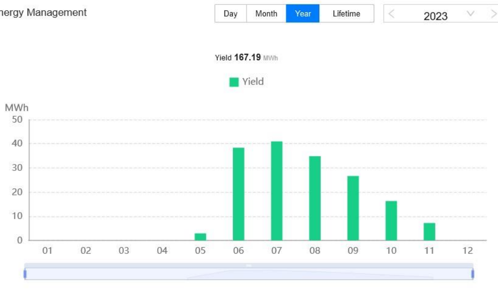
Diagram letne proizvodnje MFE CERO 260 KW, načrtovana proizvodnja za leto 2024 je 285 MWh.

Na področju ravnanja z odpadki se v zadnjih letih srečujemo z veliko izzivi. Spreminjajo se navade potrošnikov in s tem tudi struktura ter sestava odpadkov, ki nastajajo pri povzročiteljih. Dejavnost se srečuje tudi z velikimi okoljskimi spremembami na področju zakonodaje. Dolgoročni cilj je zmanjšati količino ustvarjenih odpadkov. Tam, kjer je nastajanje odpadkov neizogibno, jih predelati kot vir ter doseči višje stopnje recikliranja in varnega odstranjevanja odpadkov. To pomeni, da je treba preprečevati in zmanjševati nastajanje odpadkov ter preiti na krožno gospodarstvo s čim večjim vračanjem odpadkov v gospodarstvo in pri tem zaščititi okolje in ljudi.