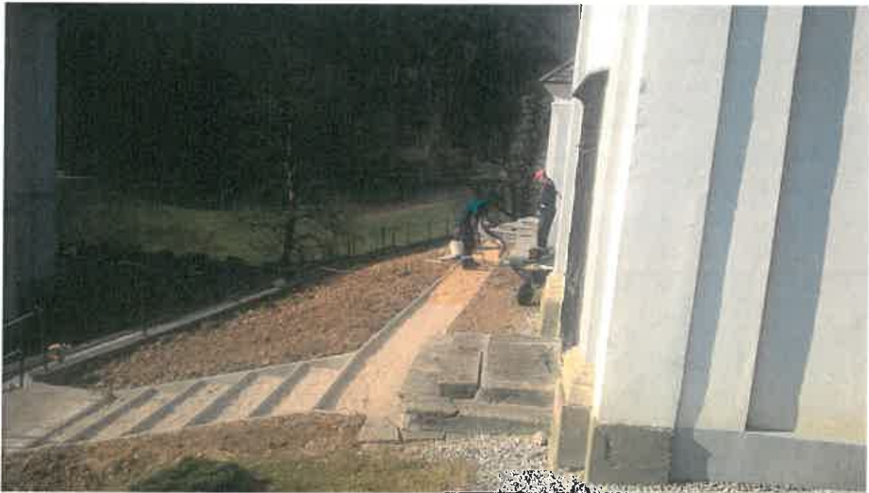
Foto: Izdelava novih stopnic in poti na pokopališču v Novi Štifi

Investicije v pokopališko infrastrukturo so v letu 2019: V Novi Štifi se je popravila fasada na mrliški vežici, izvedla pa se je tudi sanacija betonskih stopnic na pokopališču ter izdelava novih stopnic ter poti do božjega groba.