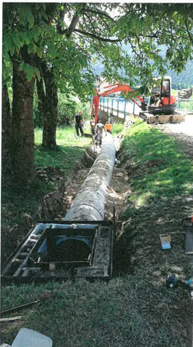
Foto: Podaljšanje propusta pri Kočnikih v Otoku

V letu 2019 je bila izvedena večina večjih del po potrjenem izvedbenem programu občinskih cest npr. obcestne ograje (Doniki, Pustosleme, Kanolščica, Sp. Bezovšek), talne označbe (POŠ Nova Štifta in Bočna), spomladanski strojni pomet, čiščenje vegetacije ob cestah (npr. ob vseh cestnih ograjah, Bočna – Semprimož, v Lenartu...), nasipanje bankin praktično ob vseh asfaltnih cestah, strojno čiščenje jarkov po celotni občini, vzdrževanje večine makadamskih cest, ter večja dela npr. zamenjava propusta pri Rosci v Novi Štifti, komplet oprema vseh odprtih jaškov v Mačkinem Kotu z LTŽ pokrovi, meteorna kanalizacija Skočnik in Kočnik v Otoku, odvodnjavanje pod Vbo v Bočni, izgradnja več armiranobetonskih propustov (npr. Lamprečje, Knebote), asfaltiranje prekopov in posedkov po celi občini ter asfaltiranje pri Urlepi v Gornjem Gradu...