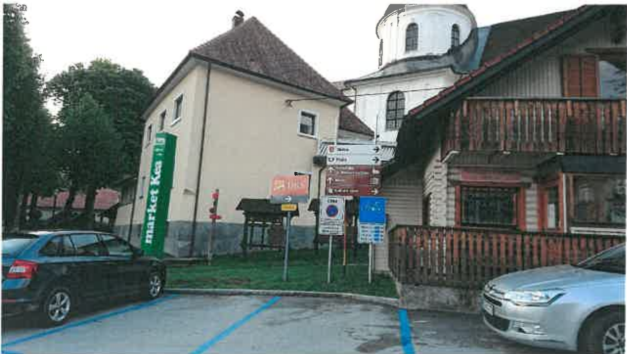
Foto: Obcestna signalizacija pri trafiki med preurejanjem

V centru Gornjega Grada smo sodelovali pri delih za novo tržnico, izvedli prestavitev oglasnih tabel ter uredili (racionalizirali) občestno signalizacijo, v Bočni smo postavili novo turistično info tablo pod gričem.