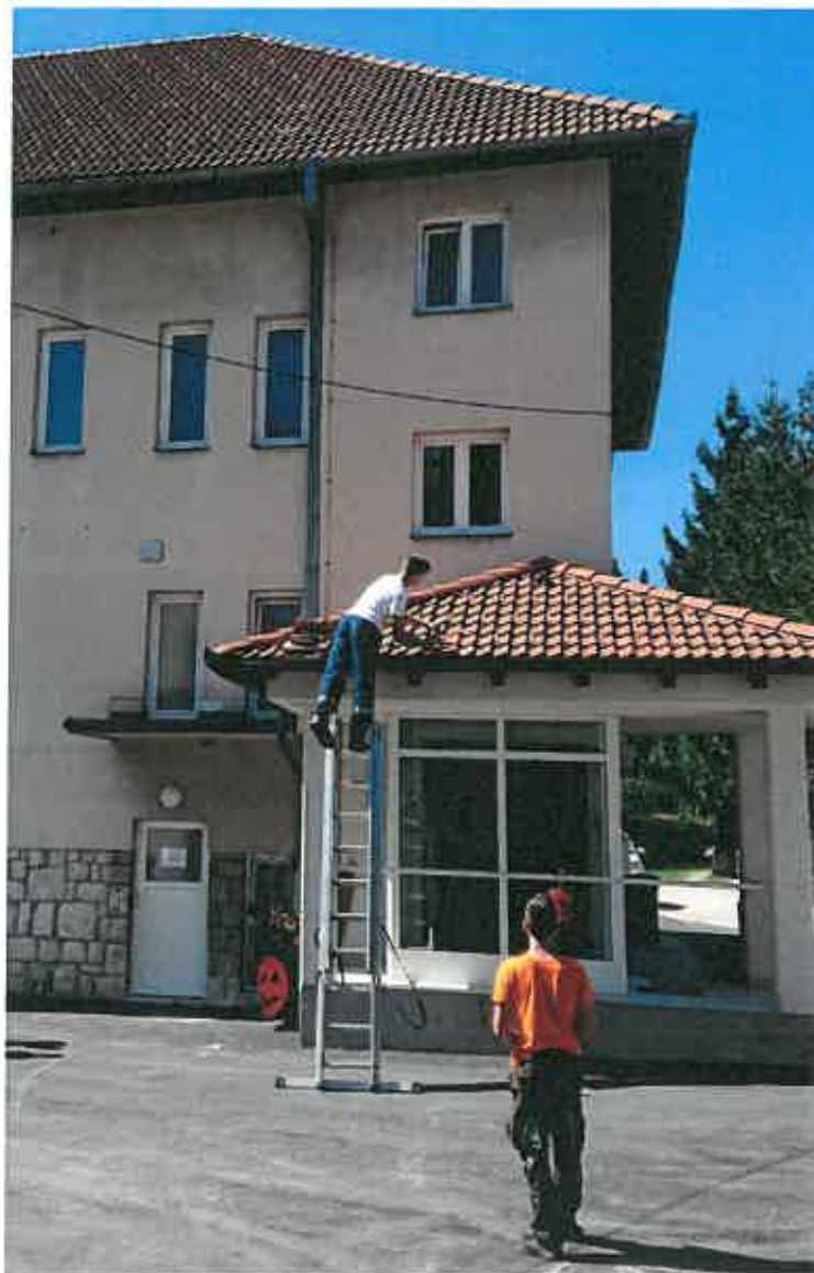
Foto: Sanacija streh na zdravstvenem domu

Ostajamo upravnik večstanovanjskega objekta Attemsov trg 23 »Posojilnica«.