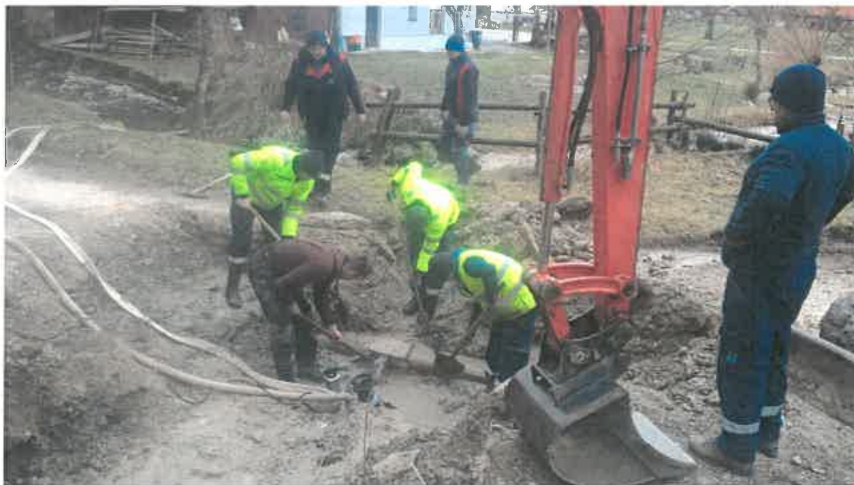
Foto: Odprava defekta na primarnem vodovodu v Zgornjem Dolu (salonit) za Gornji Grad