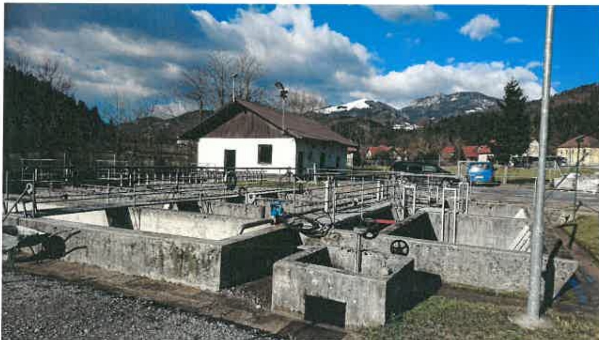
Foto: Čistilna naprava Gornji Grad

Tudi v letu 2019 ni bilo izvedeno: naprava za dehidriranje odpadnega mulja, naprava za sprejem grezničnih muljev, lamele lamelnega usedalnika.