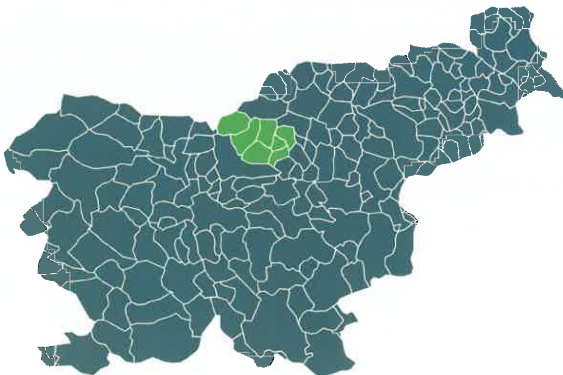
Slika 1: Občine ustanoviteljice