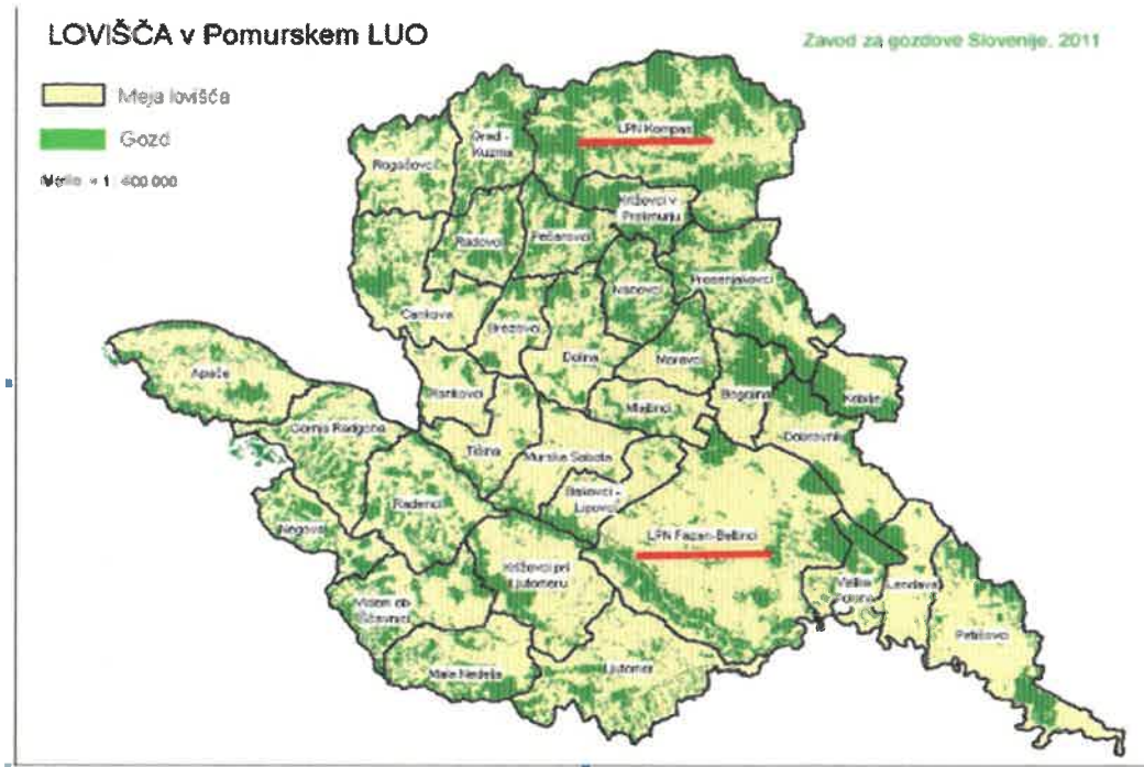
Prikaz dveh LPN v Pomurju, ki ju upravlja Zavod za gozdove Slovenije.