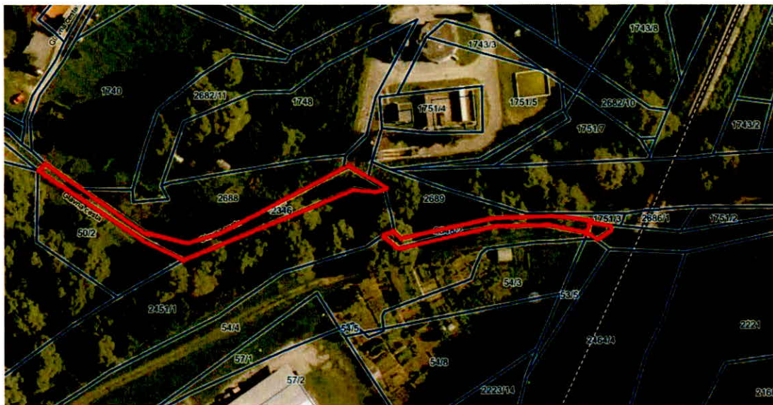
Parcele v k.o. Mirna: 2348/2; 2348/3 in 2346