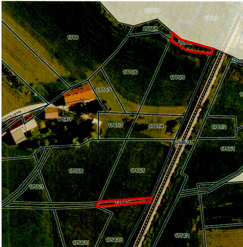
Parcele v k.o. Straža: 2558/9 in 2558/7