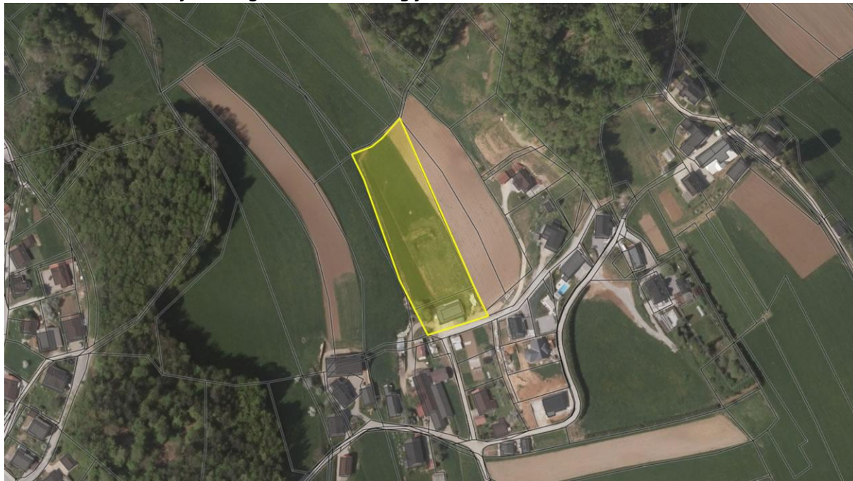
Slika 6: Mikrolokacija novega strelišča in kegljišča