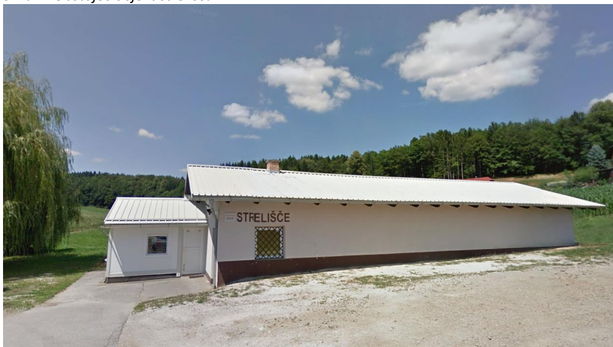
Slika 1: Obstoječ objekt strelišča

Vir: Google Maps, https://maps.google.com , julij 2021