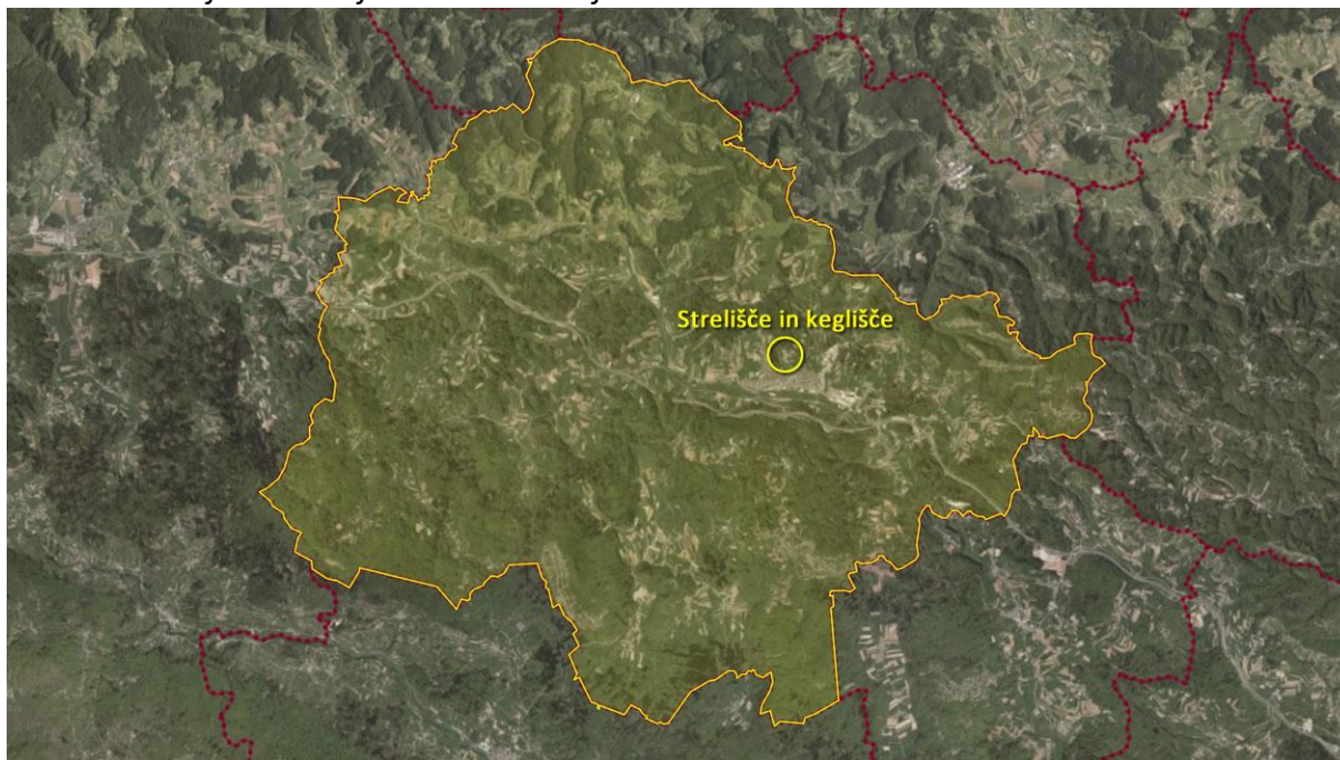
Slika 4: Lokacija investicije v občini Trebnje