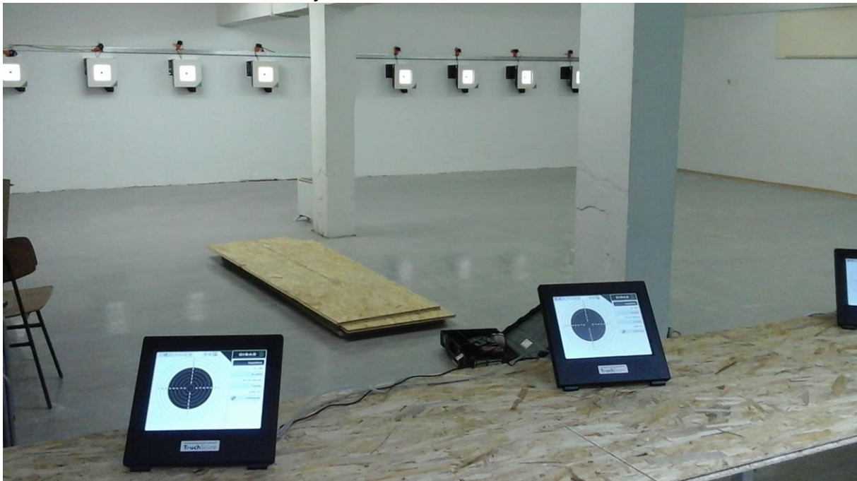
Slika 2: Elektronske tarče na obstoječem strelišču