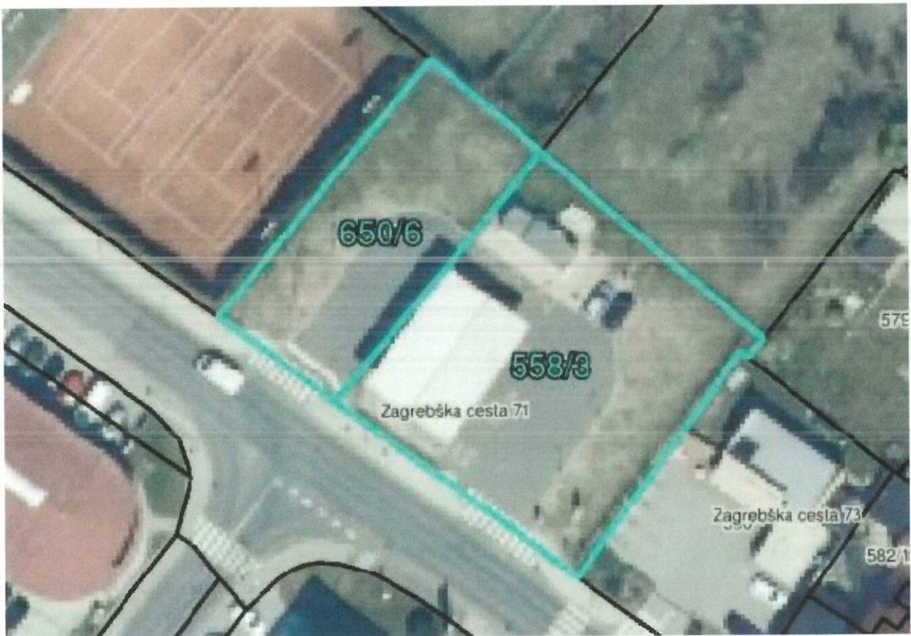
Slika 1: Lokacija polnilne postaje na CNG