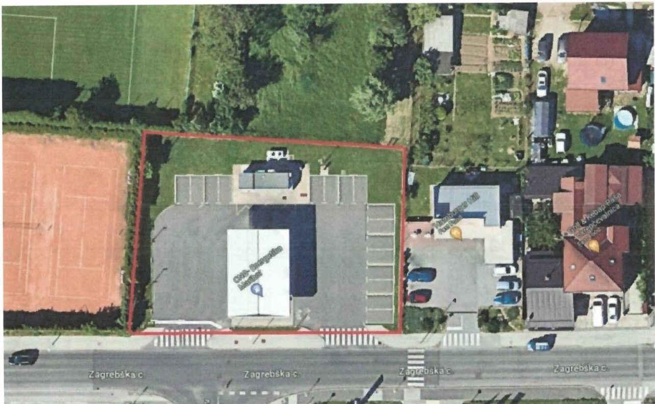
Slika 2: Umestitev novih parkirnišč na lokaciju