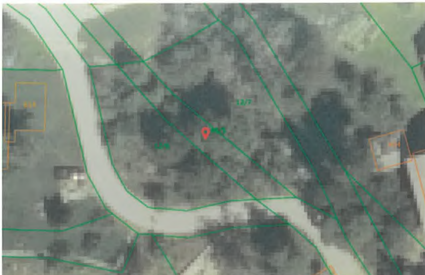
parc. št. 1140/5 k. o. 2085 – Babni vrt