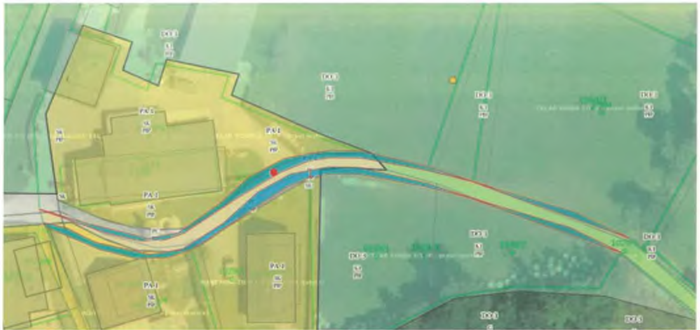
parc. št. 1029/6 in 1029/8, k. o. 2085 – Babni vrt