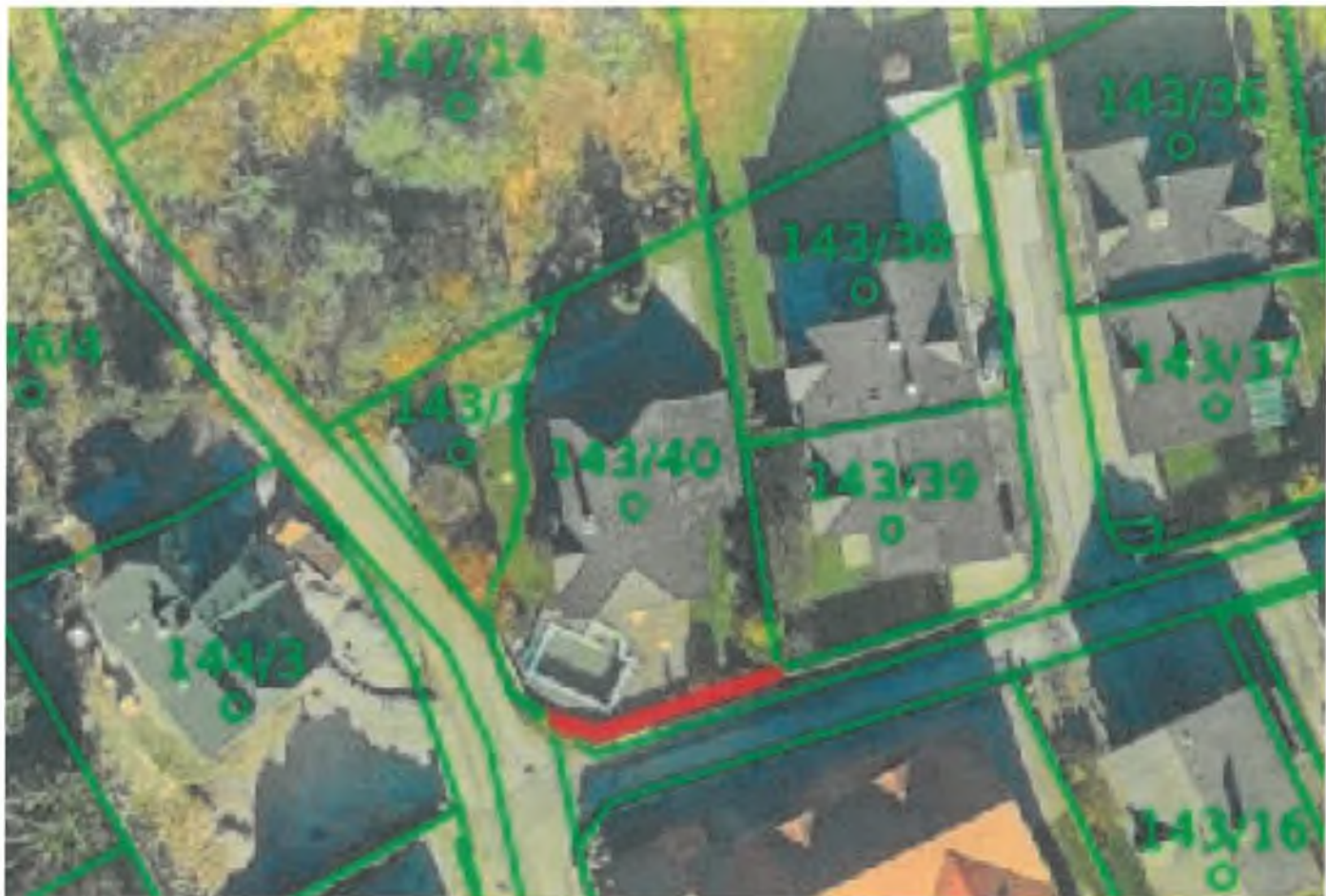
parc. št. 143/47 k. o. 2090 – Vojvodin boršt I