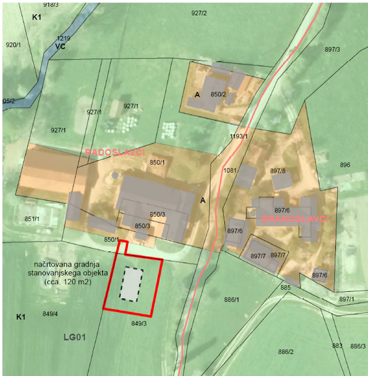
Slika 4: Prikaz območja LP in predvidene umestitve novega stanovanjskega objekta na izseku iz OPN in digitalnem ortofoto načrtu.