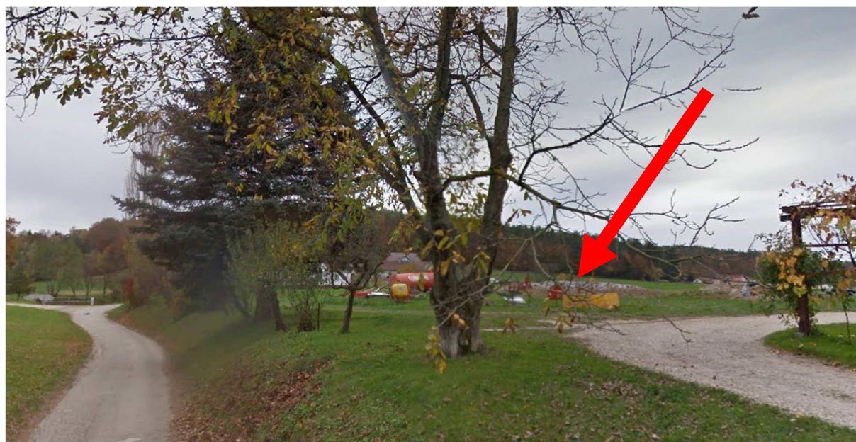
Slika 2: Slika območja LP.