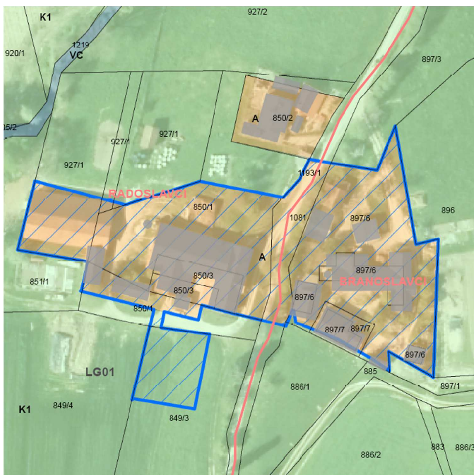
Slika 5: Prikaz novega območja posamične poselitve na izseku iz OPN in digitalnem ortofoto načrtu.