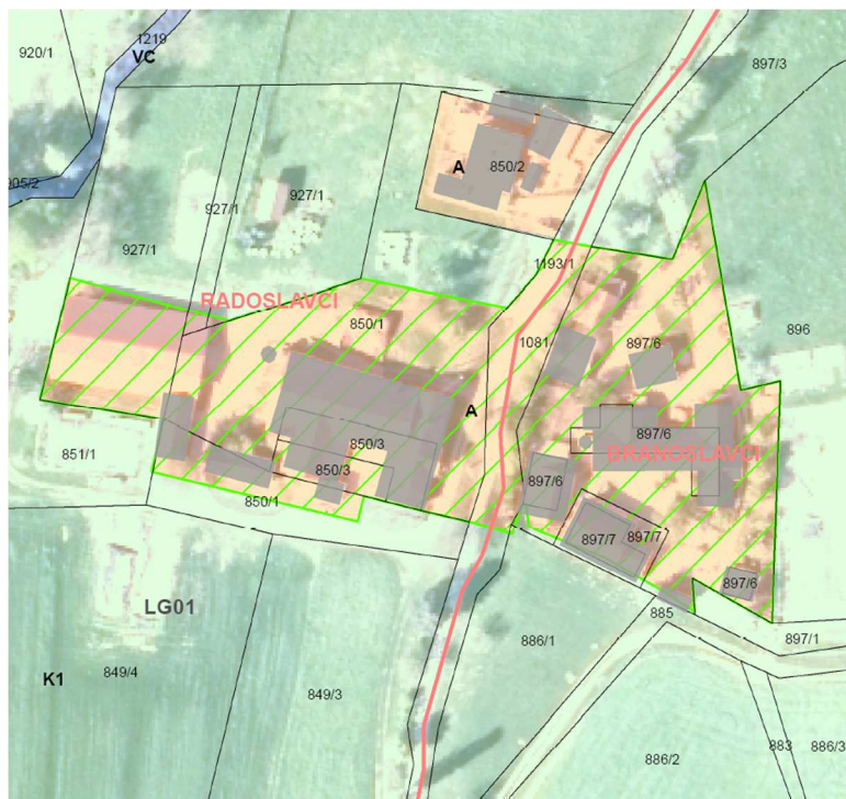
Slika 1: Prikaz izvornega območja LP na izseku iz OPN in digitalnem ortofoto načrtu.