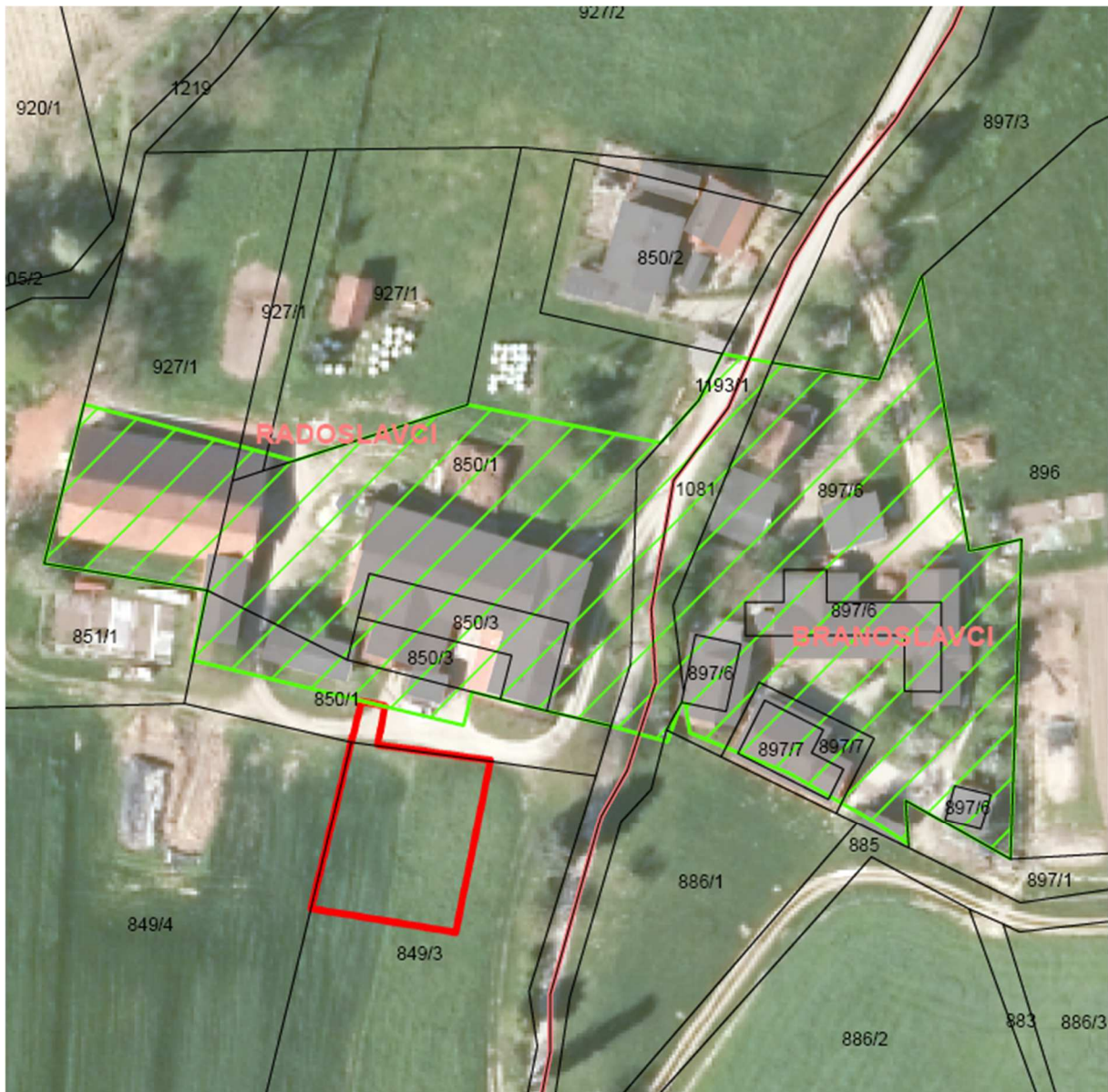
Slika 6: Prikaz izvornega območja LP in območja LP na digitalnem ortofoto načrtu in ZKP (30.9.2019).