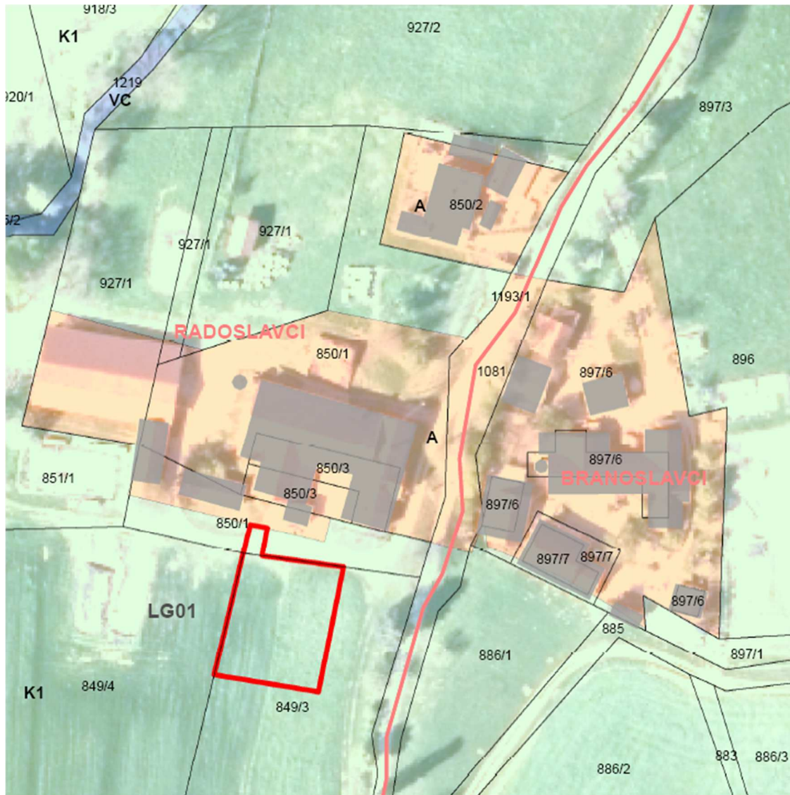
Slika 3: Prikaz območja LP na izseku iz OPN in digitalnem ortofoto načrtu.