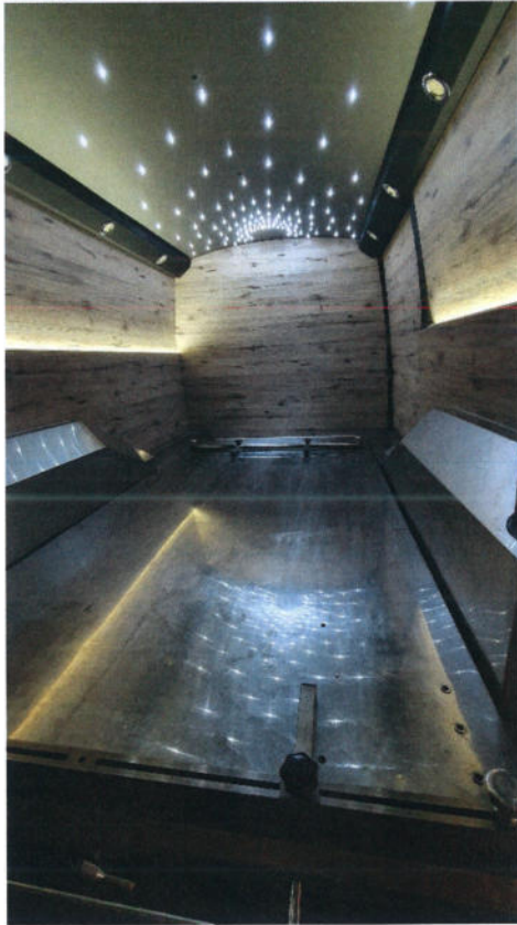
Notranjost pogrebnih vozil