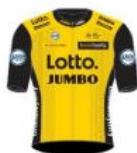
Team Lotto NL Jumbo