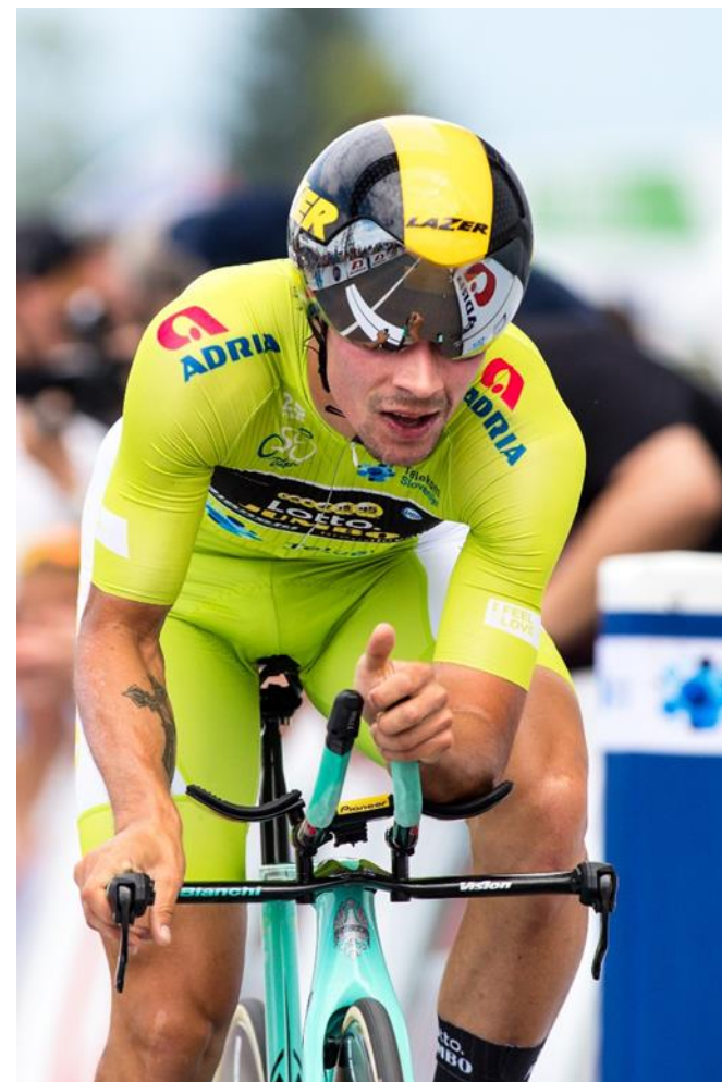
Zmagovalec 2018: Primož Roglič