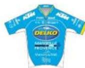
Delko Marseille Provence