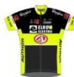
Elkov Author Cycling