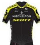
Mitchelton - Scott