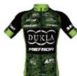
Dukla Banska Bystrica