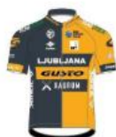
Ljubljana Gusto Xaurum