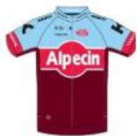
Team Katusha Alpecin