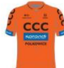
CCC Sprandi Polkowice