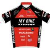
My Bike - Stevens