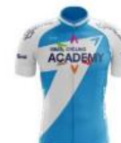
Israel Cycling Academy