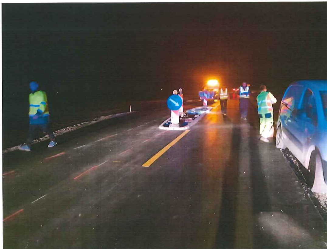
Slika 3 Intervencija po prometni nezgodi