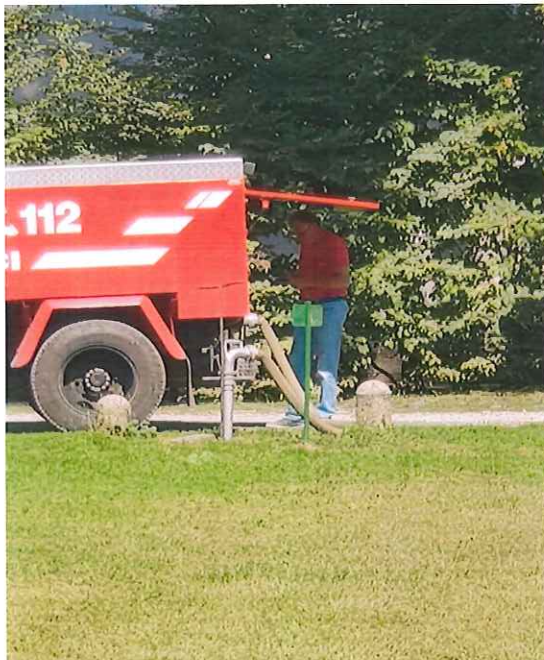
Slika 2 Polnilna postaja Beltinci

V okviru javnega hidrantnega omrežja deluje tudi polnilna postaja za izvajanje polnjenja požarne/tehnične vode v cisterne.