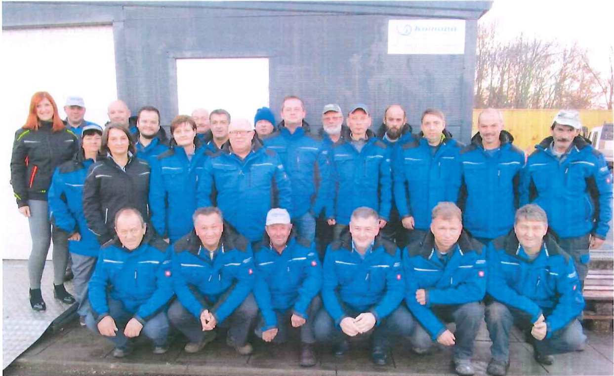
Slika 1 Kolektiv družbe Komuna Beltinci d.o.o.