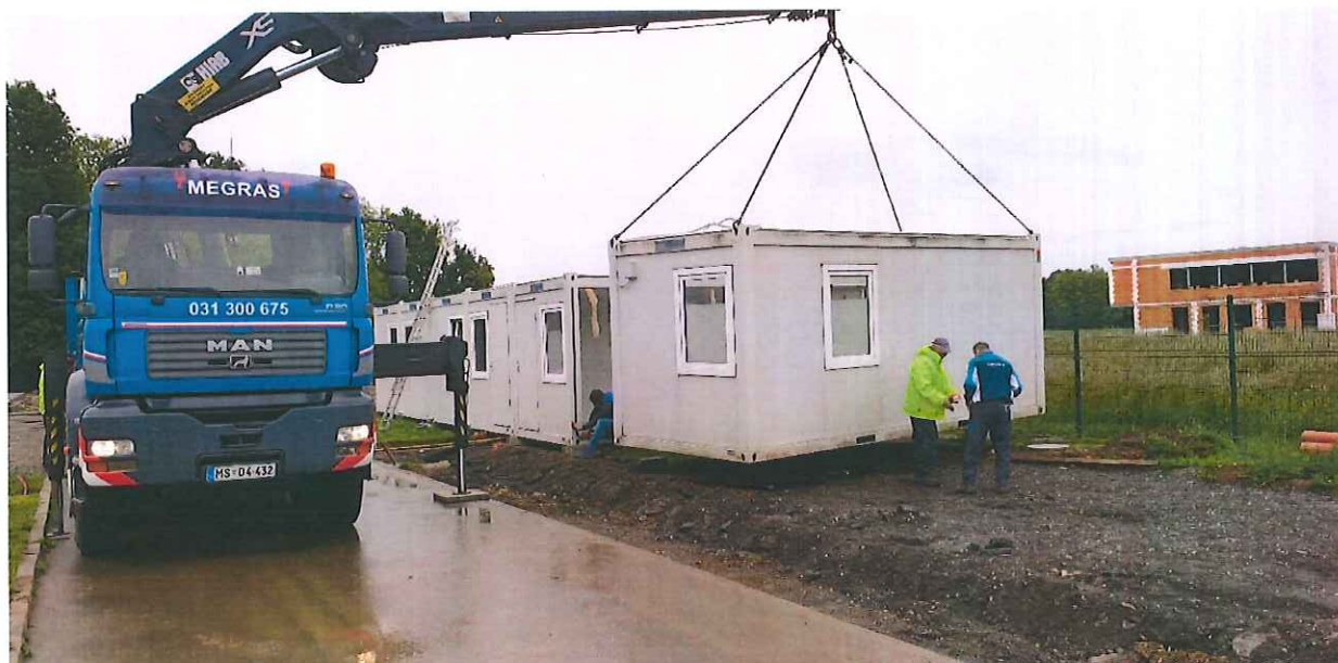
Slika 7 Gradnja Komuninega logističnega centra v Beltincih

pa načrtujemo še izgradnjo nadstrešnice za mehanizacijo. Po zaključku del bomo razpolagali z cca. 500 m 2 , pokritih površin in 900 m 2 nepokritih površin.