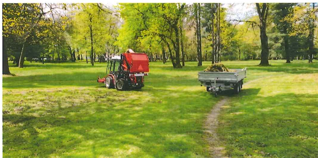
Slika 6 Park Beltinci

Po evidencah vzdrževalca je v občini Beltinci cca. 384.000 m 2 površin, ki smo jih čez leto pokosili v povprečju 5 krat in cca. 70.000 m 2 površin (igrišča), ki smo jih v povprečju pokosili 70 krat. Skupaj smo tako v letu 2019 pokosili več kot 6.1 mio m 2 površin, kar smo opravili v 1.923 strojnih urah, 1.883 urah redno zaposlenih in 10.440 urah udeležencev v programih javnih del (ure udeležencev programov javnih del so evidentirane niso pa obračunane)