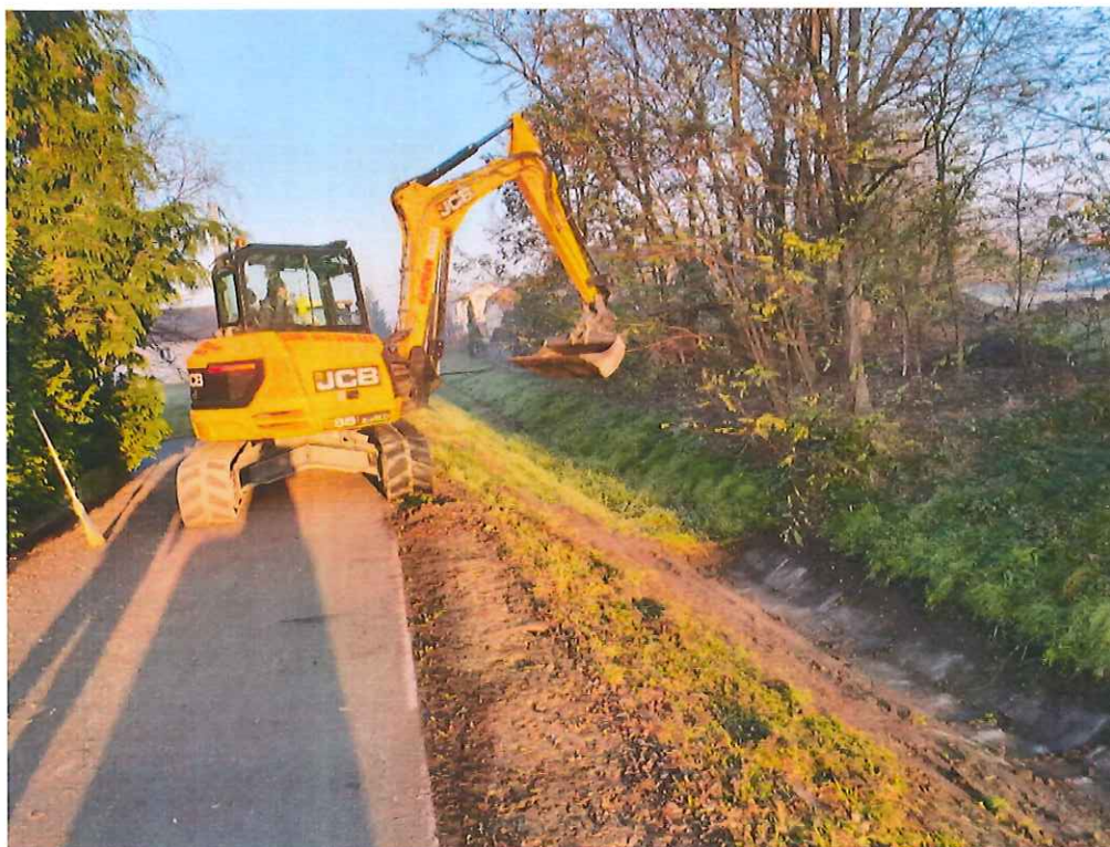
Slika 5 Čiščenje vodotoka Črnc

Po evidencah vzdrževalca je v občini Beltinci cca. 384.000 m 2 površin, ki smo jih čez leto pokosili v povprečju 5 krat in cca. 70.000 m 2 površin (igrišča), ki smo jih v povprečju pokosili 70 krat. Skupaj smo tako v letu 2019 pokosili več kot 6.1 mio m 2 površin, kar smo opravili v 1.923 strojnih urah, 1.883 urah redno zaposlenih in 10.440 urah udeležencev v programih javnih del (ure udeležencev programov javnih del so evidentirane niso pa obračunane)