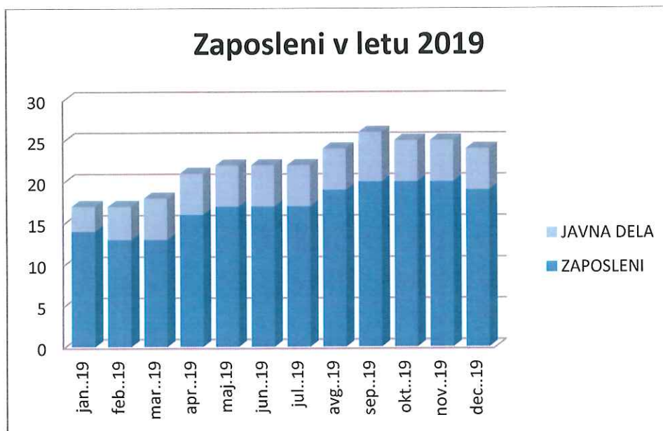
Graf 1 Zaposleni v letu 2019

Na dan 31.12.2019 je bilo v podjetju zaposlenih 17 redno zaposlenih in 5 udeležencev programov javnih del.