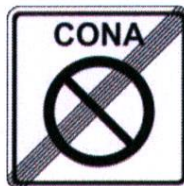
2420 Konec območja prepovedanega parkiranja

Parkirna mesta, določena za kratkotrajno parkiranje, bodo označena z talnimi oznakami: