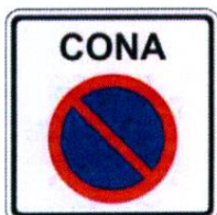
2419 Območje prepovedanega parkiranja

Območje parkirišča bo označeno s postavitvijo prometnih znakov: