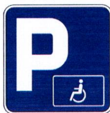
2441 Parkirno mesto