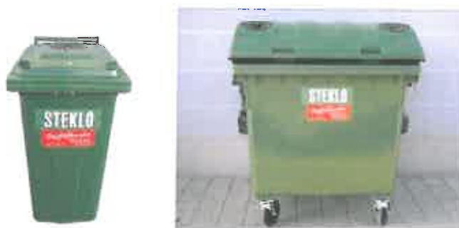
Slika 8 : Namenska embalaža za zbiranje steklene embalaže