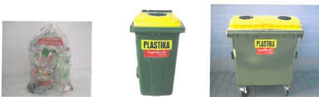
Slika 5 : Namenska embalaža za zbiranje plastične, kovinske, sestavljen in mešane embalaže