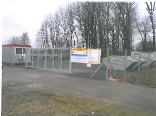
Slika 9 : Zbirni center ločenih frakcij Radenci

Zbirni center ločenih frakcij se nahaja v naselju Boračeva, na lokaciji pri stari žagi, parc. št. 55/3 in 55/5, k.o. Boračeva.