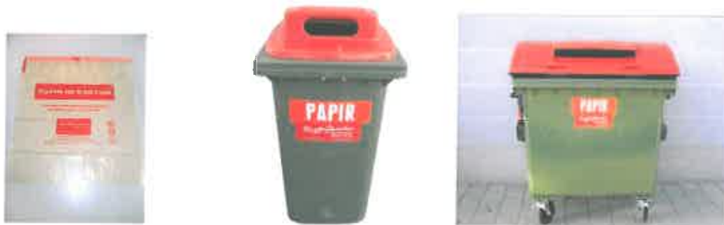
Slika 4 : Namenska embalaža za zbiranje papirja in papirne embalaže