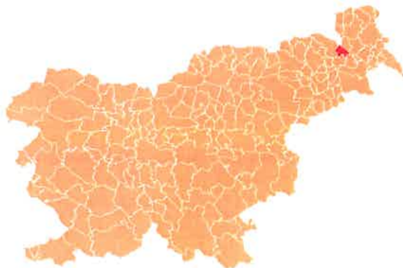
Slika 2: Lega Občine Radenci v Republiki Sloveniji