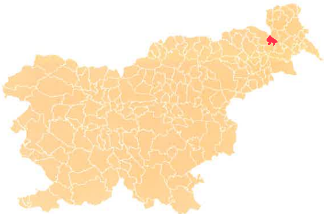
Slika 2 : Lega Občine Radenci v Republiki Sloveniji