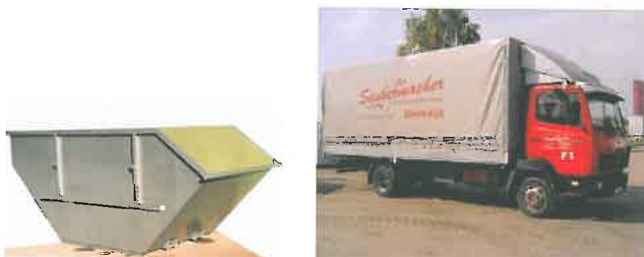
Slika 7 : Namenska embalaža in specialno vozilo za zbiranje kosovnih odpadkov