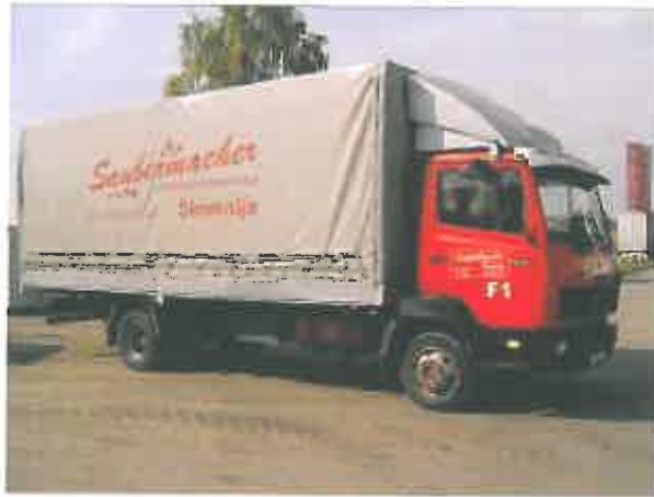
Slika 10 : Premična zbiralnica nevarnih frakcij