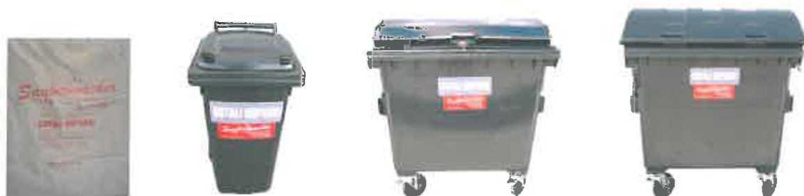
Slika 3 : Namenska embalaža za zbiranje mešanih komunalnih odpadkov