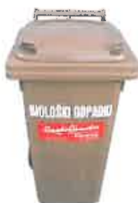
Slika 6 : Namenska embalaža za zbiranje biorazgradljivih odpadkov