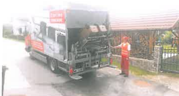
Slika 11 : Vozilo za pranje zabojnikov za zbiranje odpadkov

Če pride pri prevzemanju odpadkov do onesnaženja prevzemnega mesta oziroma mesta praznjenja embalaže in nalaganja odpadkov ali njihove okolice, mora izvajalec zbiranja komunalnih odpadkov na svoje stroške zagotoviti odstranitev teh odpadkov ter očistiti onesnažene površine.