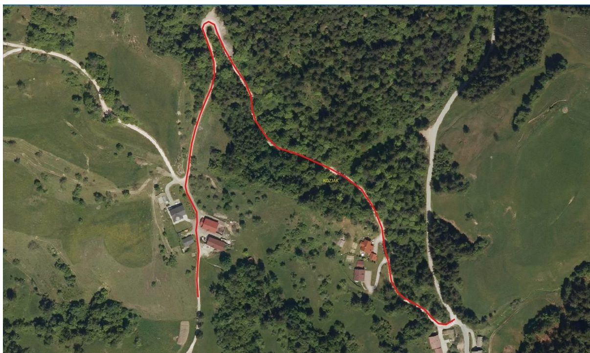
Slika 2: Slika prikazuje mikrolokacijo

Cesta poteka po zemljiških parcelah k.o. Kozjak št.: 92, 105/1, *3, 105/2, 76, 1399/2, 93/1, 100, 107/1, 108, 1556/9, 156/2, 3, 252/2, 156/10, 96/3 in 1391/2.