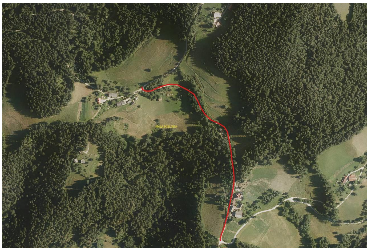
Slika 2: Slika prikazuje mikrolokacijo

Cesta poteka po zemljiških parcelah k.o. 864 – Mislinja. Parcele: 366/2, 366/6, 364/3, 366/7, 2229/5, 362/5, 359/5, 360/3, 79/7, 79/9, 78/4, 77/3, 73, 71/7, 2245/1.