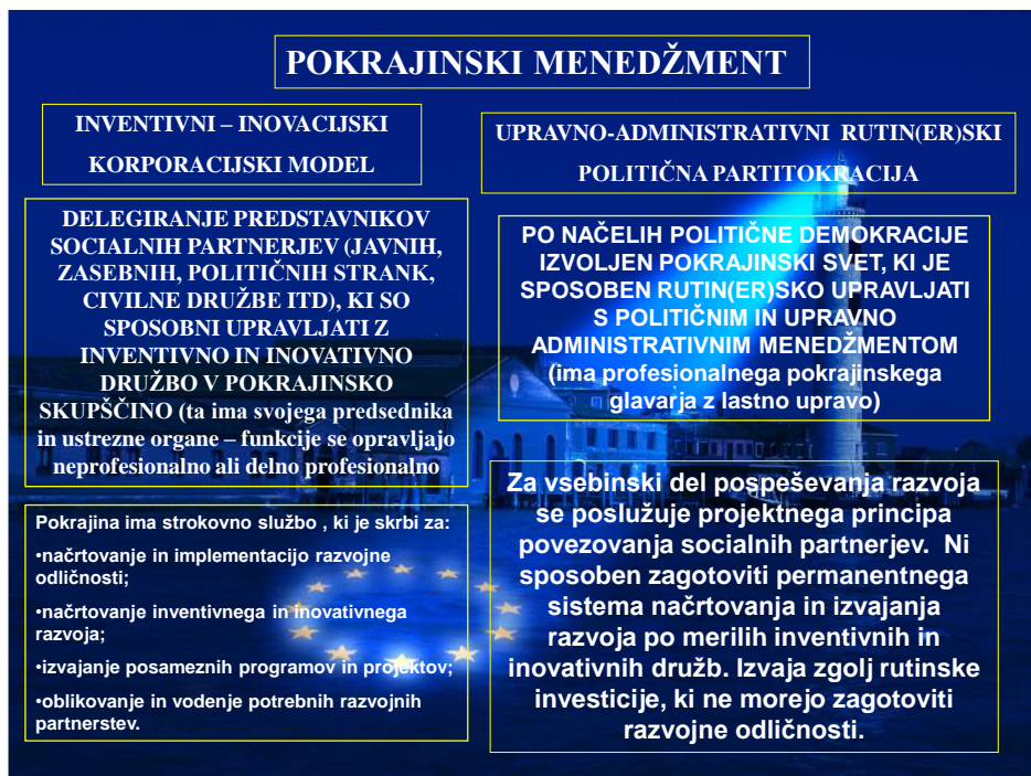
Slika 2: Razlika med inventivnim, inovativnim in upravno-administrativnim modelom pokrajine