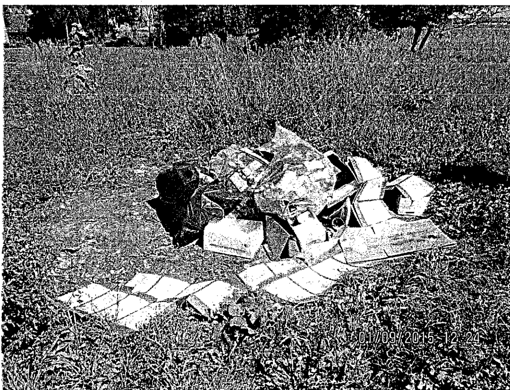
Slika 5: Primer nepravilnega odlaganja odpadkov

V to področje nadzora sodi tudi kurjenje odpadkov. Odpadkov ni dovoljeno kuriti, predajati jih je potrebno izvajalcu javne službe zbiranja in prevoza odpadkov, obvezno je tudi ločeno zbiranje posameznih frakcij in jih ločeno odložiti na ekološki otok, za plastiko, embalažo in konzerve pa je organiziran tudi odvoz neposredno od gospodinjstev. Občina Apače pa ima na tem področju že sprejet nadstandard ravnanja s komunalnimi odpadki, saj so se s 1.7.2014 ukinili ekološki otoki in se vse vrste komunalnih odpadkov zbirajo in odvažajo neposredno od gospodinjstev, možno pa jih je tudi brez dodatnega plačila odložiti na zbirnem centru.