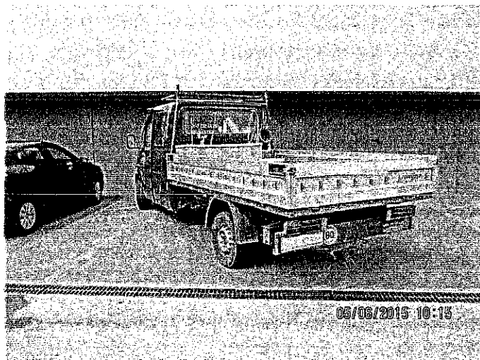
Slika 2 in 3: Primer nedovoljenega parkiranja

Na tem področju opažamo, da smo iz leta v leto uspeli zmanjšati delež prekrškov nepravilnega oz. nedovoljenega parkiranja na pločniku, parkirnih mestih za invalide ali delu ceste, kjer je prost prehod med parkiranim vozilom in neprekinjeno črto ali robom vozišča manj kot 3 metre, kar dejansko pomeni oviranje ali ogrožanje prometa oziroma onemogočanje parkiranja osebam s posebnimi potrebami. Prav tako se je občutno zmanjšalo število kršitev na delih oz. območjih, kjer je bila že večkrat postavljena samodejna merilna naprava za merjenje hitrosti.