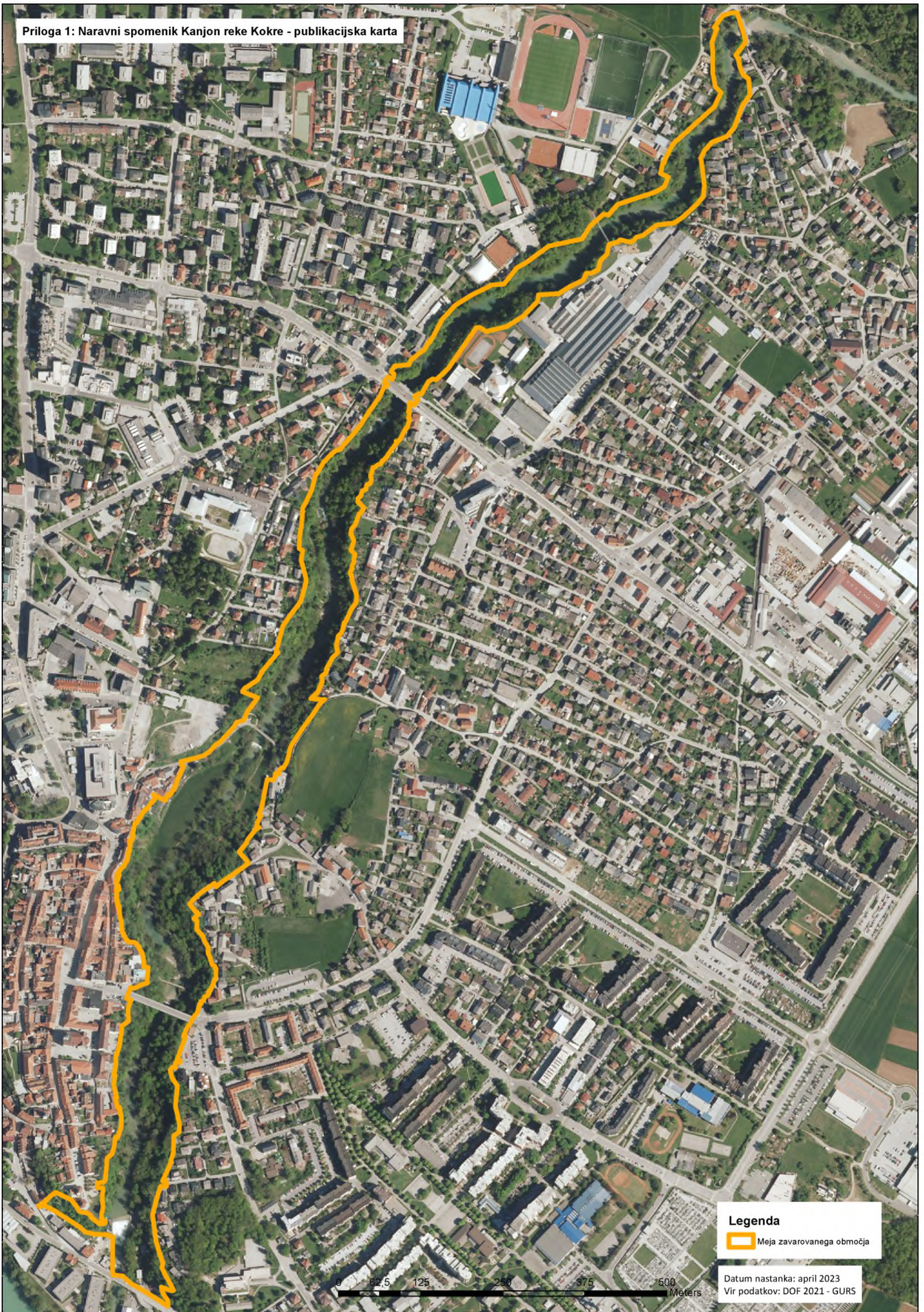
Priloga 1: Naravni spomenik Kanjon reke Kokre - publikacijska karta