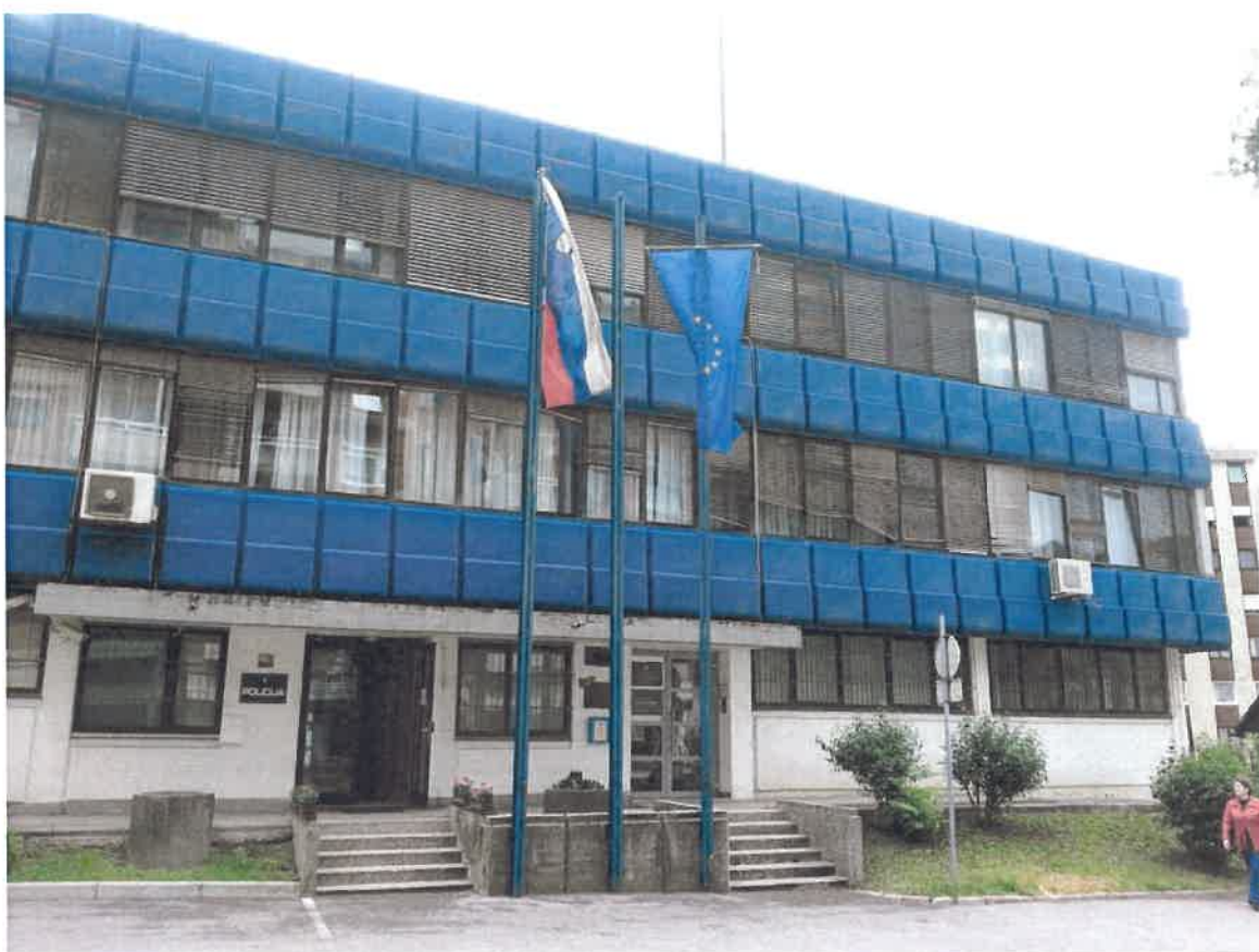
Slika 2: Objekt PP Trbovlje

Objekt Policijske postaje Trbovlje se nahaja na območju KS Franc Fakin, na naslovu Obrtniška cesta 12, Trbovlje, kjer je strnjeno naselje stanovanjskih in poslovnih objektov. Zaradi več poslovnih objektov in dejavnosti ter zgradbe občine (kjer se nahaja tudi upravna enota), se na tem območju v času uradnih ur, občasno nahajajo tudi državljani iz drugih območij regije ali države.