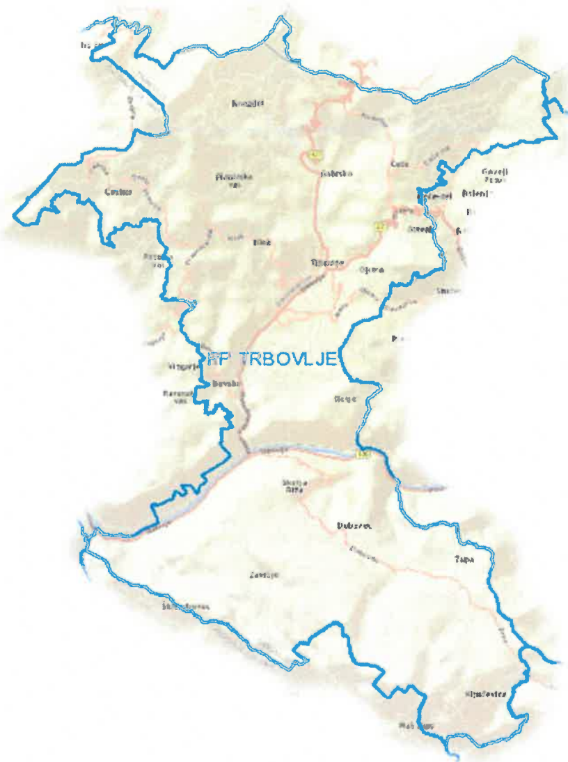
Slika 1: Območje PP Trbovlje

Policijska postaja Trbovlje je ena od 18 območnih policijskih postaj v Policijski upravi Ljubljana. Deluje na območju srednje velike občine Trbovlje, ki se nahaja v zasavski regiji in meji na šest občin, Zagorje ob Savi, Hrastnik, Radeče, Tabor, Prebold in Žalec. S sosednjo občino Zagorje ob Savi je kraj povezan z glavno cesto proti Ljubljani in regionalno cesto preko Slačnika, s sosednjo občino Hrastnik pa prav tako z glavno cesto v smeri Zidanega Mostu in regionalno cesto prek Ojstrškega prevala, ter naselja Čeče. Do občine Prebold je povezava po regionalni cesti preko prelaza Podmeja, kamor se nato dostopa tudi do ostalih sosednjih občin.