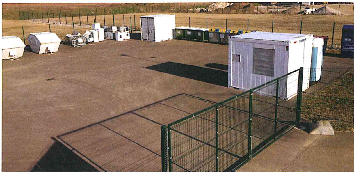
Zbirni center Videm

Vsi občani se morajo ob vstopu v zbirni center identificirati z osebnim dokumentom ali prejetim računom podjetja Čisto mesto Ptuj d.o.o.