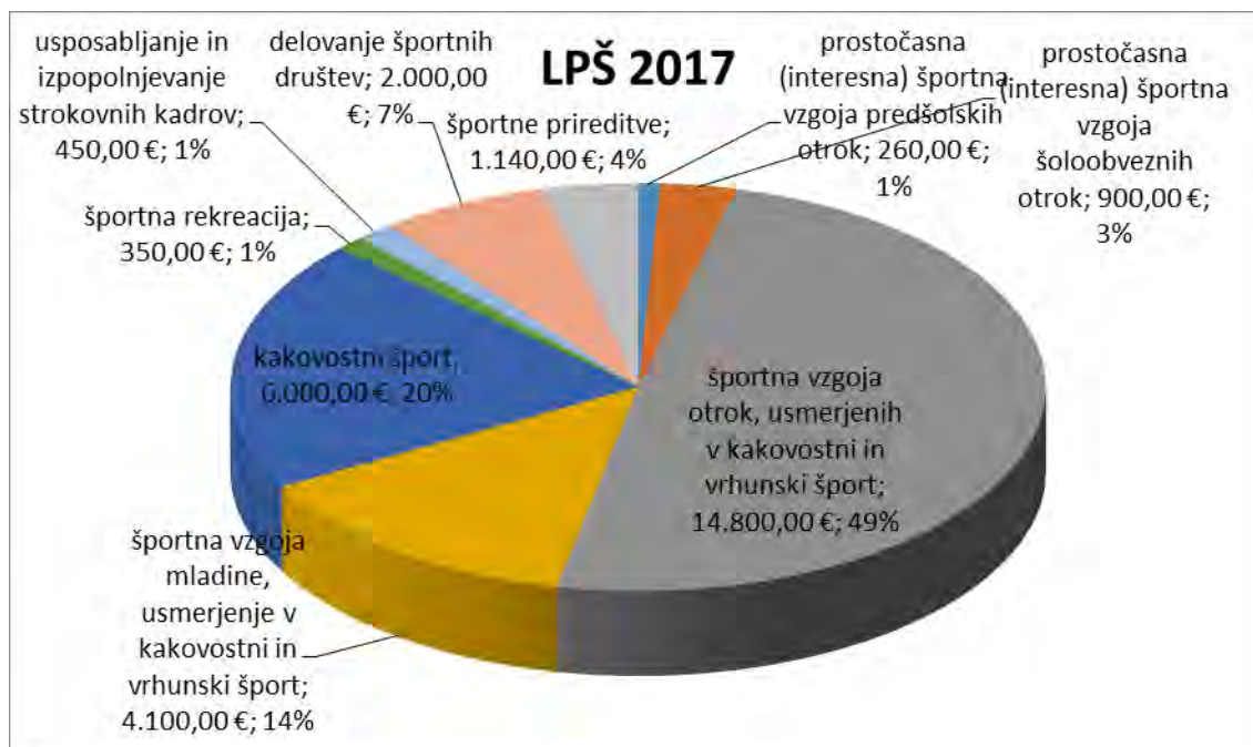
Graf 1: Razrez sredstev letnega programa športa 2017

Letni program športa v Občini Benedikt za leto 2017 predvideva okvirno višino sredstev po posameznih programih. Spodnji graf prikazuje razrez sredstev po programih v odstotkih glede na celotno višino predvidenih sredstev za programe športa v proračunu Občine Benedikt za leto 2017, ki znaša 30.000,00 €.