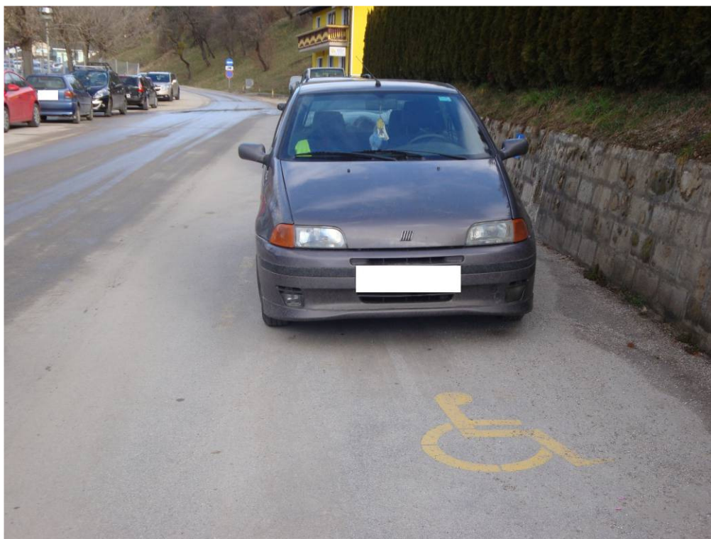
Slika 3: Napačno parkirano vozilo.