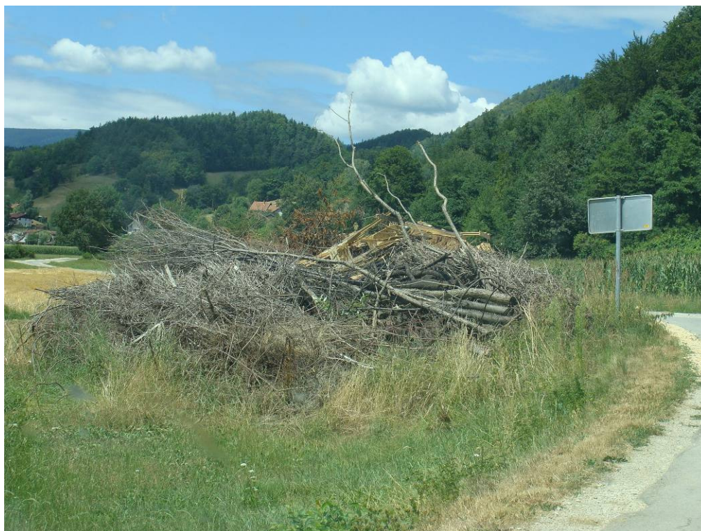
Slika 5: Ovirana preglednost ob občinski cesti ali neurejenost.

Glede na dejstvo, da občino obišče veliko turistov, smo se z opozarjanjem lastnikov neurejen okolice in objektov trudili, da ne izgubi slovesa lepo urejen občine.