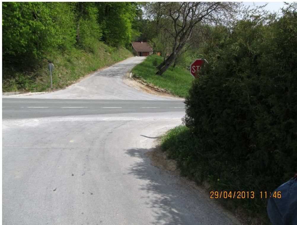
Slika 4: Zaraščeno prometno signalizacijo.

V okviru varstva cest in udeležencev cestnega prometa smo pregledovali tudi razraščeno živih mej in drugega rastlinja v varovalnih pasovih občinskih cest. Prav tako smo sodelovali pri prometnih ureditvah, podajali smo predloge in pripombe na odvečno, pomanjkljivo ali neustrezno prometno signalizacijo, ki smo jo pri opravljanju vsakodnevnih nalog opazili.