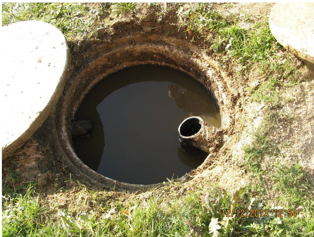
Slika 7: Preverjanje ureditve interne kanalizacije.