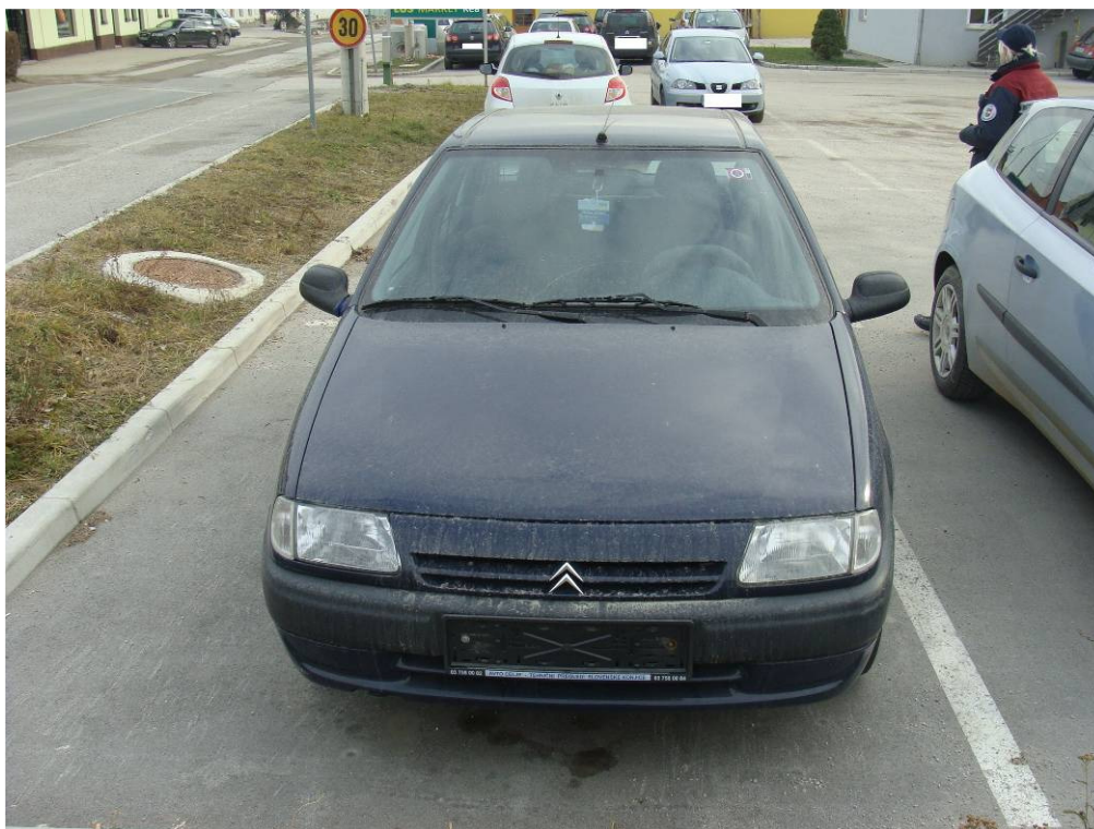
Slika 2: Zapuščeno vozilo.

Obravnavali smo le dve zapuščeni vozili, ki pa sta jih lastnika v odrejenem roku pravilno odstranila.