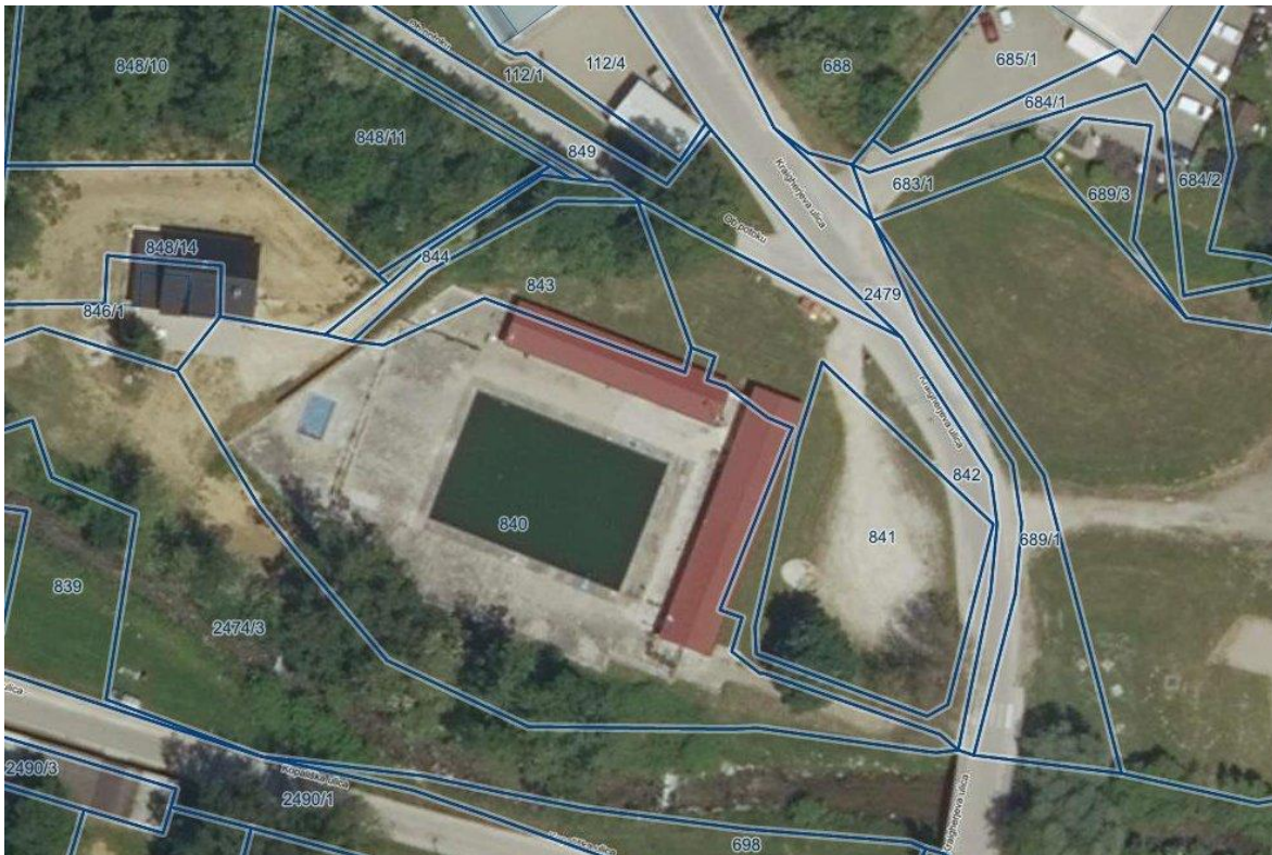
Slika 7-1: Območje obstoječega odprtega bazena

V skladu z Uredbo o enotni metodologiji za pripravo in obravnavo investicijske dokumentacije na področju javnih financ, je bil na 21. redni seji občinskega sveta obravnavan in potrjen Dokument identifikacije investicijskega projekta (v nadaljevanju DIIP) za obnovo kopališča.