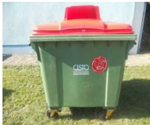
Fotografija 5 in 6: Posode za zbiranje papirja

Za zbiranje plastične embalaže ter ločenih frakcij iz plastike bomo uporabljali: