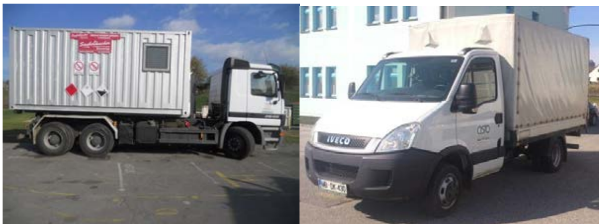
Fotografija 18 in 19: Vozila za prevoz in zbiranje nevarnih odpadkov

Za zbiranje in prevoz nevarnih frakcij uporabljamo specialna vozila, s pokritim kesonom in dovoljenjem za prevoz nevarnih snovi.