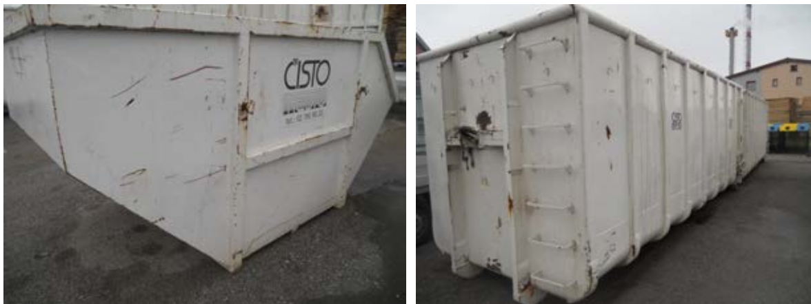
Fotografija 10 in 11: Kovinski kontejnerji