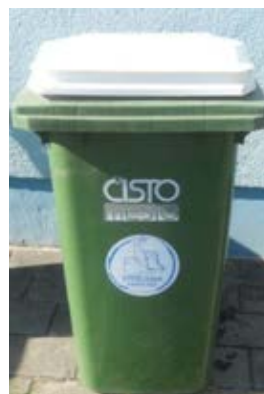
Fotografija 8 in 9: Posode za zbiranje stekla (steklene embalaže)