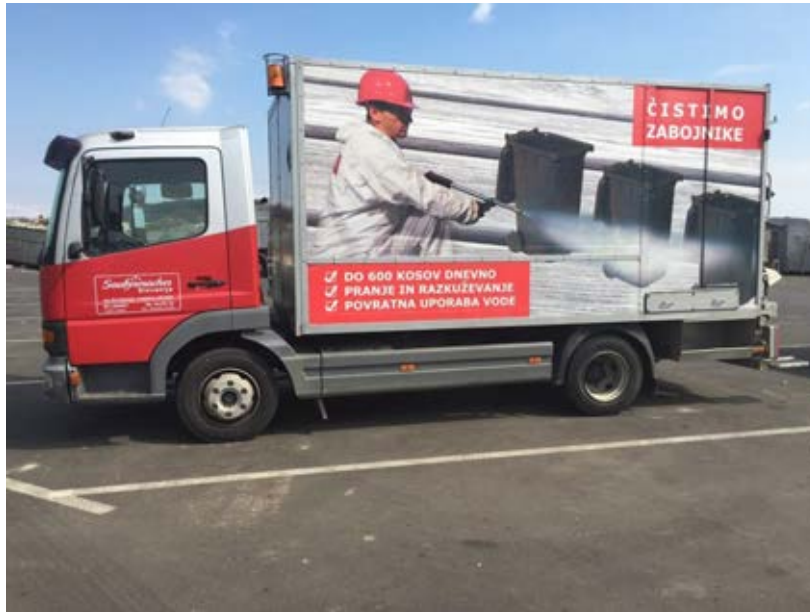
Fotografija 21: Vozilo za pranje zabojnikov za zbiranje bioloških odpadkov