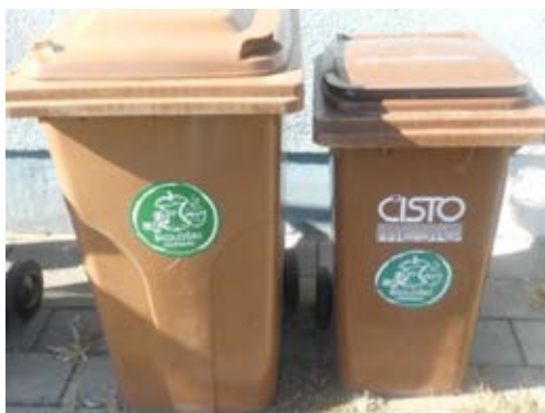
Fotografija 4: Posode za biološke odpadke