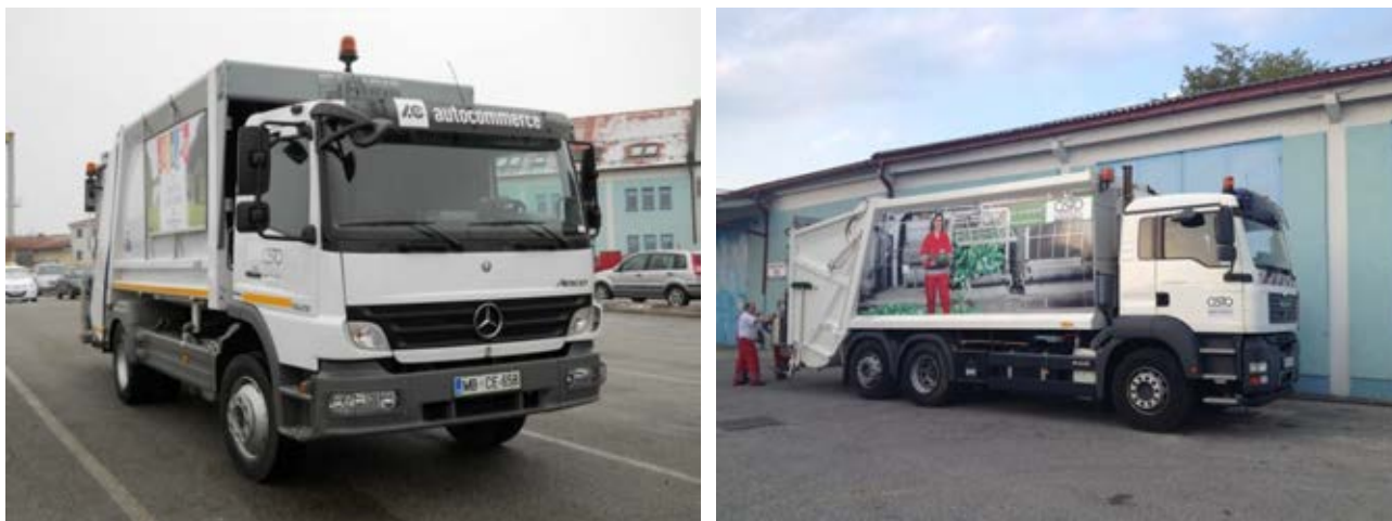
Fotografija 12 in 13: Smetarska vozila

Zbiranje in prevzem odpadkov iz posod ali vrečk: