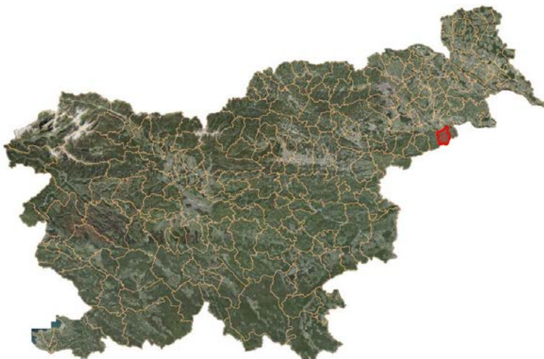
Slika 2: Lega občine Cirkulane