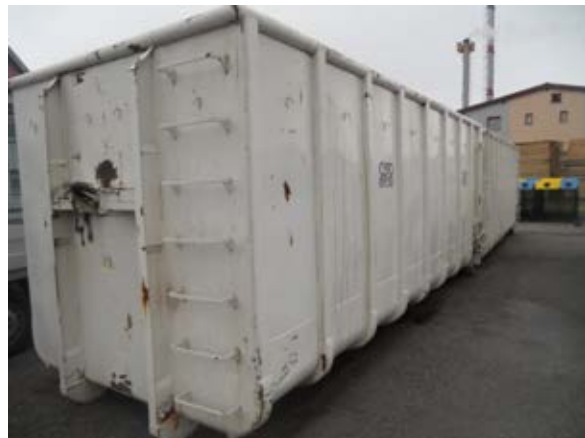
Fotografija 15 in 16: Kontejnerji različnih volumnov za zbiranje kosovnih in drugih odpadkov