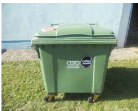
Fotografija 2 in 3: Posode za mešane komunalne odpadke