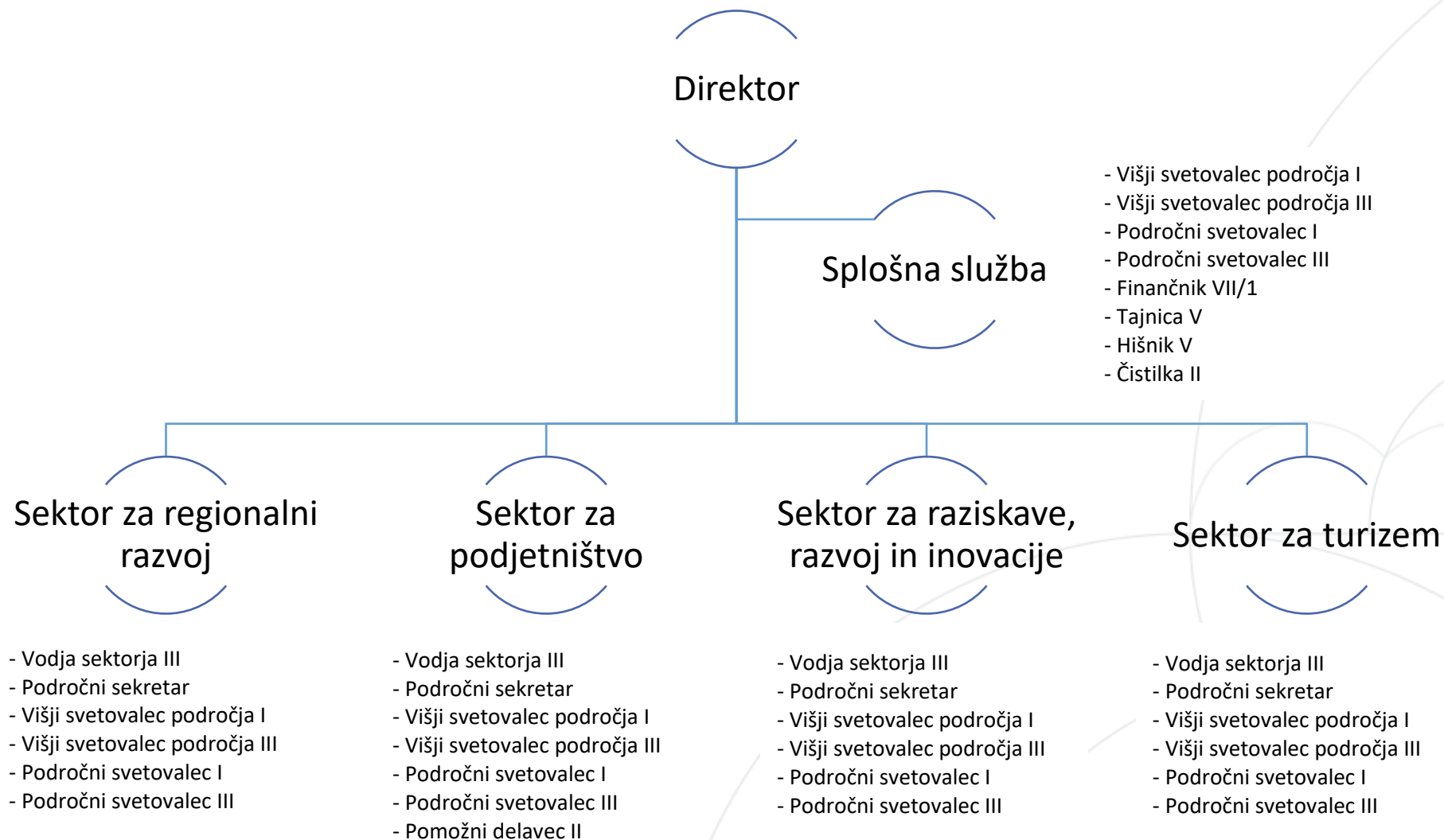
Slika 2: Organigram RRA Podravje - Maribor