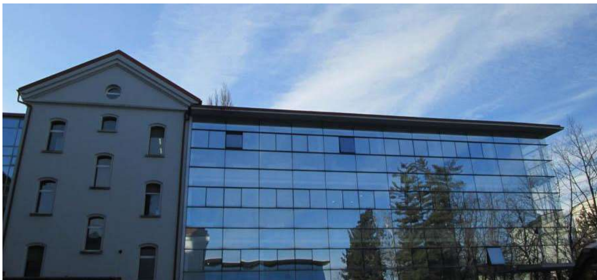
Slika 1: Kreativni park Drava

RRA Podravje - Maribor je imela v letu 2020 osem najemnikov poslovnih prostorov v zgradbi KPD (Kreativni park Drava). Najemniki zgradbe zasedajo 65,81 % prostorov, RRA Podravje - Maribor zaseda 34,19 % prostorov, praznih prostorov ni. S strani najemnikov je izražen interes po dodatnem najemu prostorov, zato v letu 2021 načrtujemo ureditev kletnih prostorov.