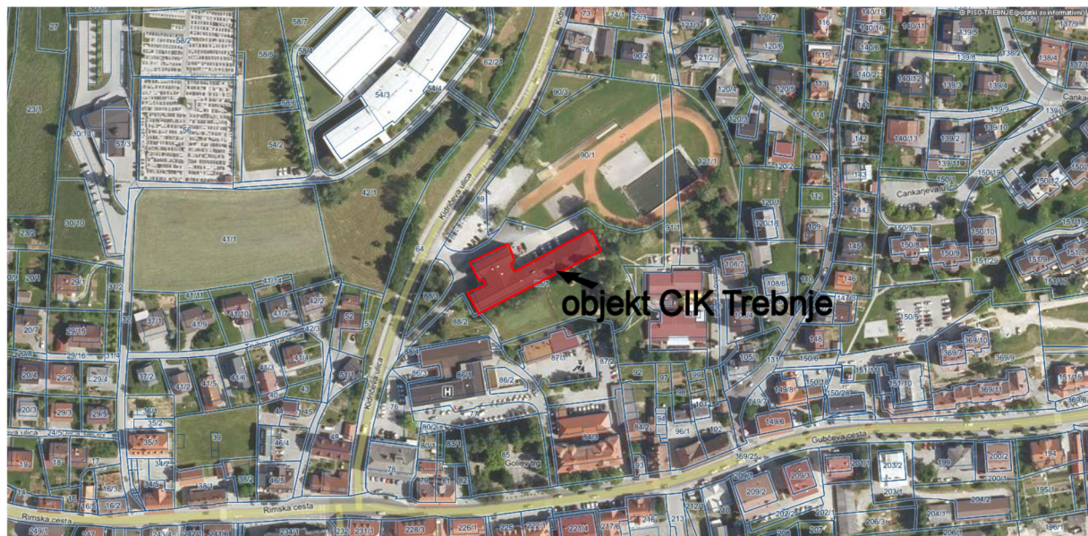
Slika: Lokacija investicije