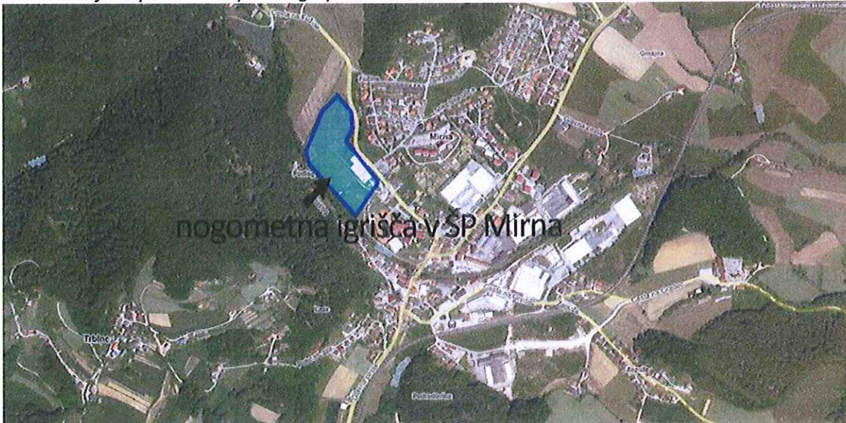
Slika: Ortofoto posnetek Športnega parka Mirna iz višine 180 m