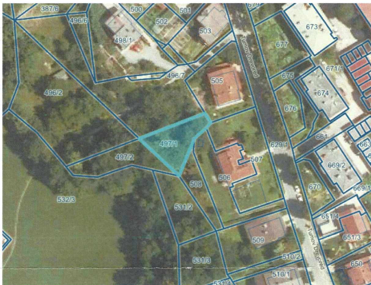
Posnetek iz programa PISO