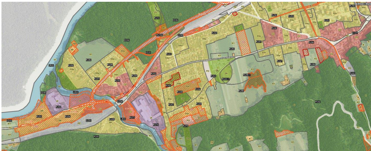
Slika 3: Izsek iz dopolnjenega osnutka OPN SD2 s prikazom podrobnejše namenske rabe zemljišč in pobud.

Po sprejemu sklepov na 20. seji OSOR v februarju 2022, je občina ustavila vse aktivnosti priprave OPPN (v teku je bila priprava okoljskega poročila za OPPN in Študija obremenitve s hrupom s predlaganimi ukrepi), ne more pa ustaviti aktivnosti sprejemanja sprememb občinskega prostorskega načrta za celo občino (OPN SD2) (z vključenima pobudama obeh tras obvoznice, torej tudi s pobudo 171- traso ob železnici), saj je bilo medtem že pripravljeno okoljsko poročilo in vse ostalo gradivo v postopku OPN SD2. Okoljsko poročilo in gradivo je bilo pripravljeno na stanje pred 20. sejo OSOR in ga zaradi dejstva, da pridobivamo sklep o ustreznosti okoljskega poročila (faza pred javno razgrnitvijo in pred prvo obravnavo OPN SD2 na občinskem svetu), ne moremo spreminjati, saj smo zaradi okoliščin, o katerih bomo člane OSOR seznanili ob prvi obravnavi, v časovnem zaostanku.