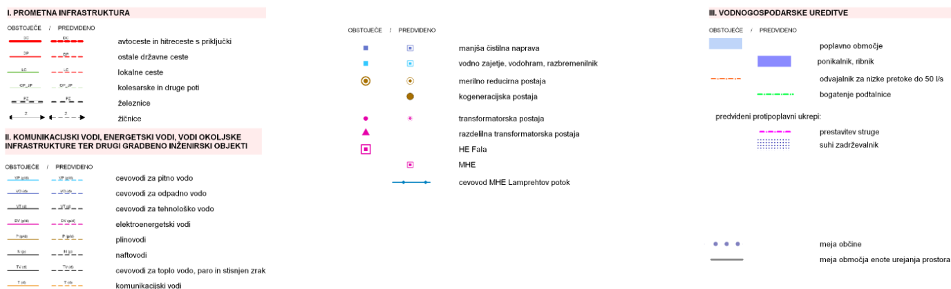
Slika 2: Izsek iz OPN.