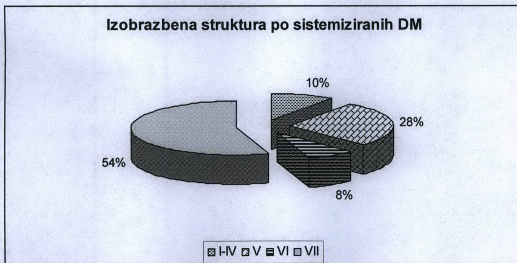
Graf št. 1: Izobrazbena struktura po sistemiziranih delovnih mestih