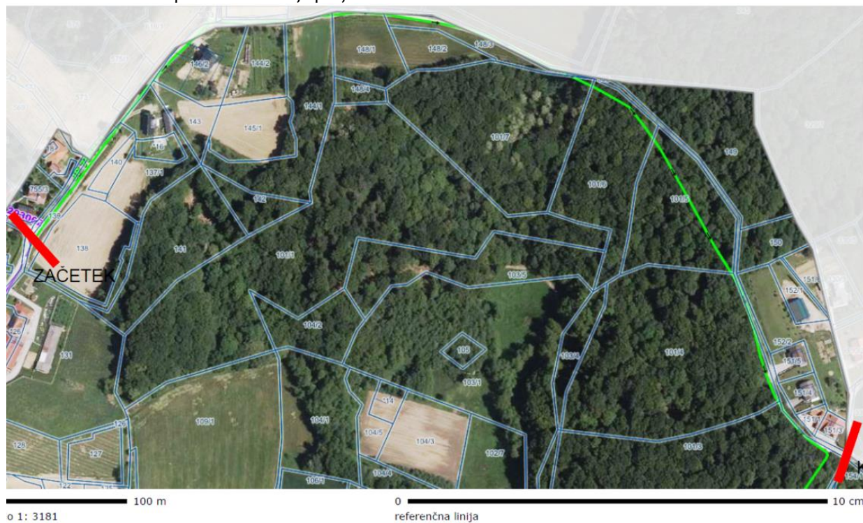
Slika IV.2.-1: Ortofoto posnetek lokacije projekta

Cesta ranga javna pot št. JP 704811 poteka po parcelnih številkah: 936 – del, k.o. Drvanja in 937 – del, k.o. Drvanja.