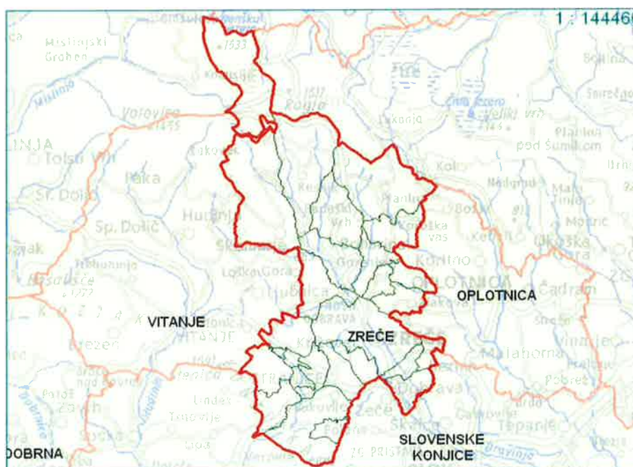
Slika 1: Območje Občine Zreče