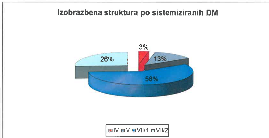
Graf št. 1: Izobrazbena struktura po sistemiziranih delovnih mestih v občinski upravi Občine Trbovlje