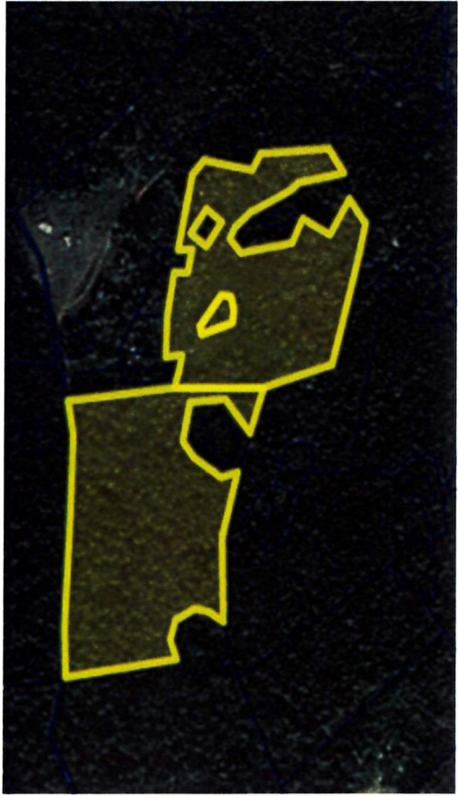
P72/24 – P73/24