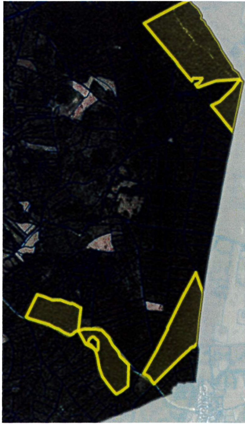
P75/24 – P79/24