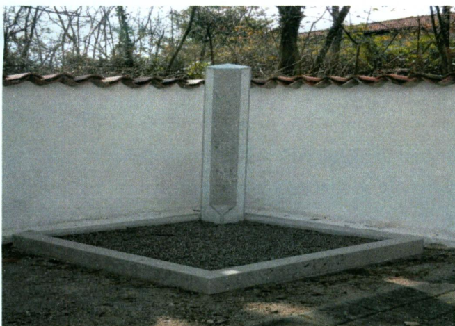
Mesto za raztros

Čez celo leto kontroliramo stanje elektrike in vode, pri čemer smo pred zimskim časom z namenom preprečevanja zmrzali na vseh pokopališčih občine Komen vodo zaprli. Na pokopališčih so bile zamenjane pipe, vse pipe so na potisk, dodali so se novi zalivalniki ter odstranili so se dotrajani.