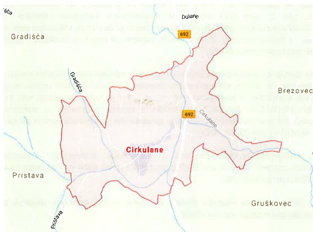
Slika 1: Zemljevid občine Cirkulane