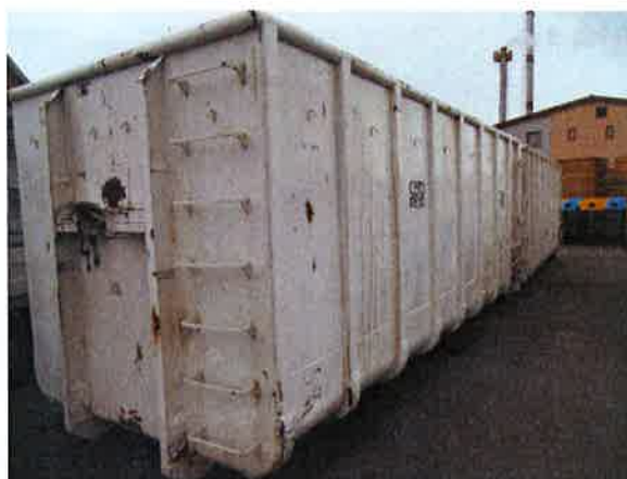
Fotografija 15 in 16: Kontejnerji različnih volumnov za zbiranje kosovnih in drugih odpadkov