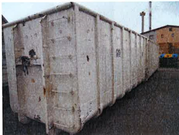
Fotografija 10 in 11: Kovinski kontejnerji