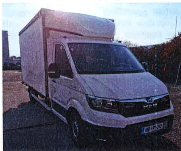
Fotografija 18: Vozila za prevoz in zbiranje nevarnih odpadkov

Za zbiranje in prevoz nevarnih frakcij uporabljamo specialna vozila, s pokritim kesonom in dovoljenjem za prevoz nevarnih snovi.