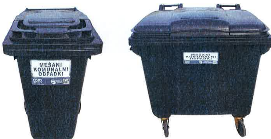
Fotografija 2 in 3: Posode za mešane komunalne odpadke