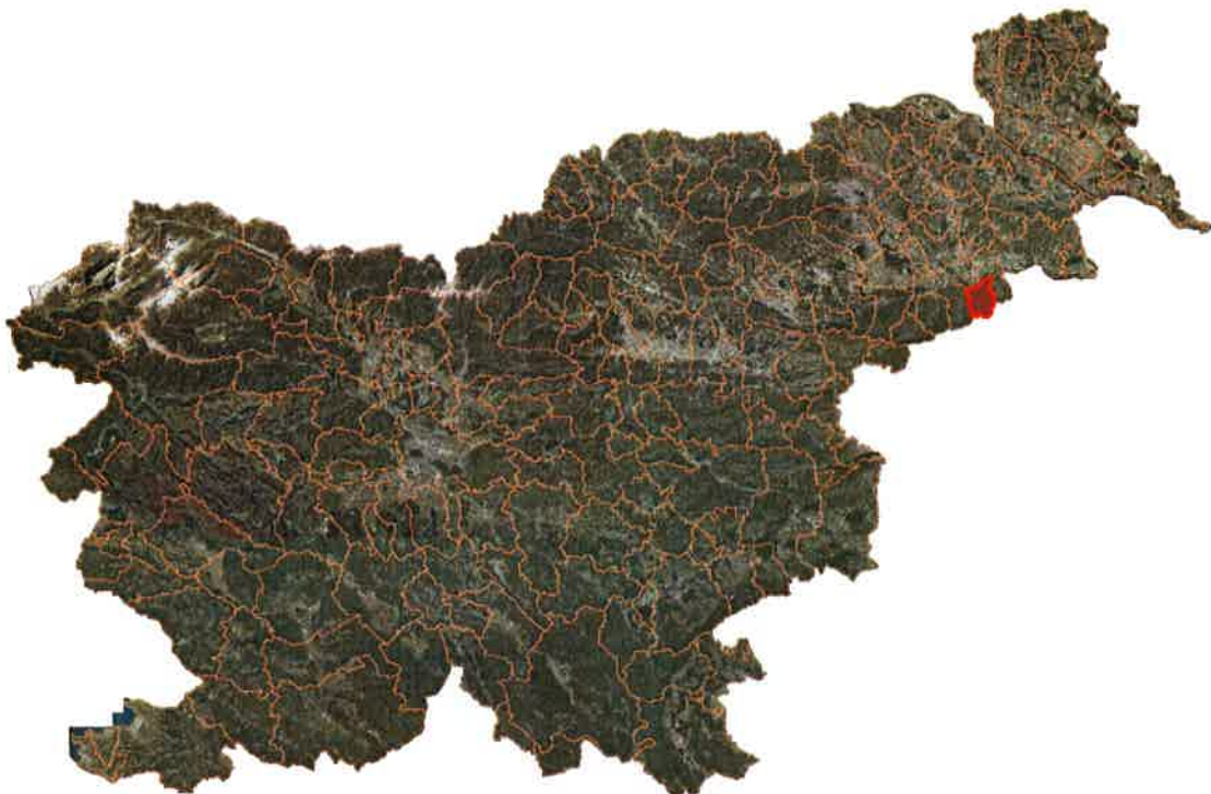
Slika 2: Lega občine Cirkulane