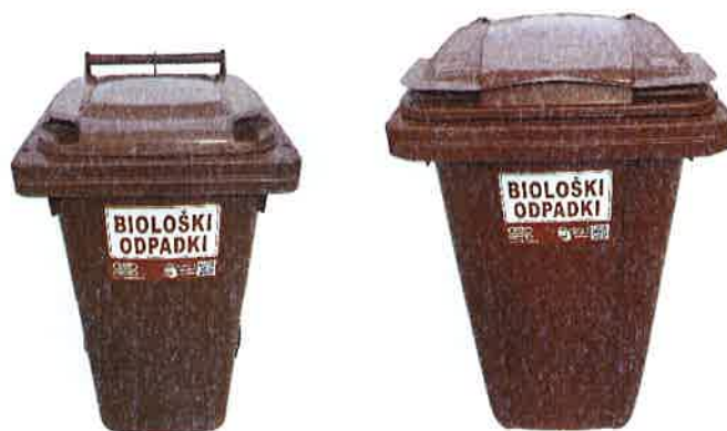
Fotografija 4: Posode za biološke odpadke