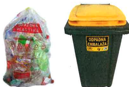
Fotografija 7: Vrečka za mešano embalažo

Za zbiranje steklene embalaže, uporabljamo plastične zabojnike, volumnov 240 l in 1100 l in sicer: