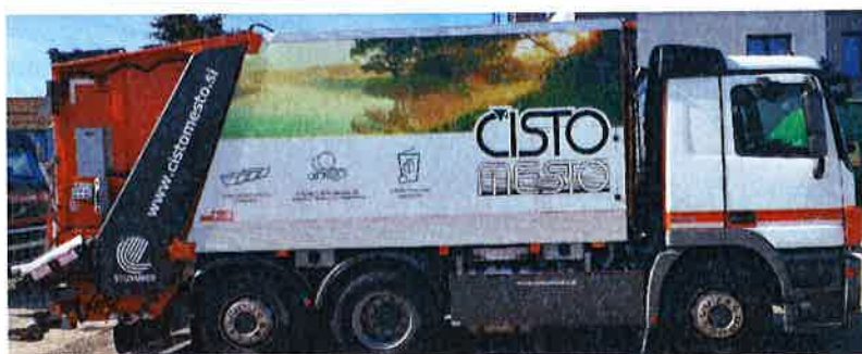
Fotografija 12 in 13: Smetarska vozila