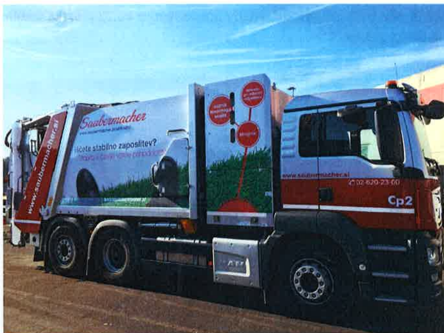
Fotografija 19: Vozilo za pranje zabojnikov za zbiranje bioloških odpadkov