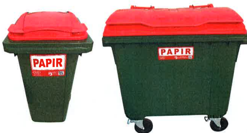
Fotografija 5 in 6: Posode za zbiranje papirja

Za zbiranje plastične embalaže ter ločenih frakcij iz plastike bomo uporabljali: