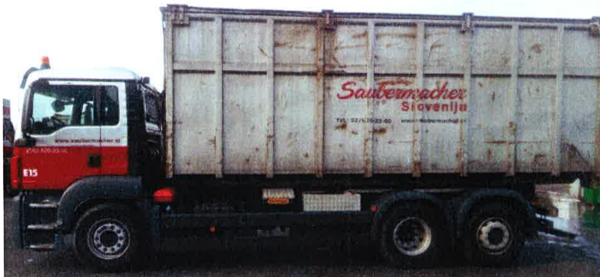
Fotografija 17: Vozilo za prevoz kotalnih prekucnikov

Za prevzemanje in prevoz kosovnih odpadkov uporabljamo kontejnerska vozila ter vozila za prevoz kotalnih prekucnikov.