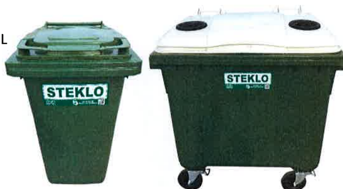
Fotografija 8 in 9: Posode za zbiranje stekla (steklene embalaže)