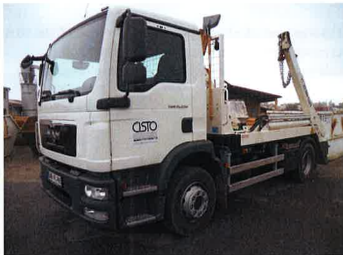
Fotografija 14: Vozilo za prevoz kontejnerjev

Za zbiranje in prevoz odpadkov iz zbirnih centrov, uporabljamo specialna komunalna vozila za odvoz kontejnerjev večjega volumna: