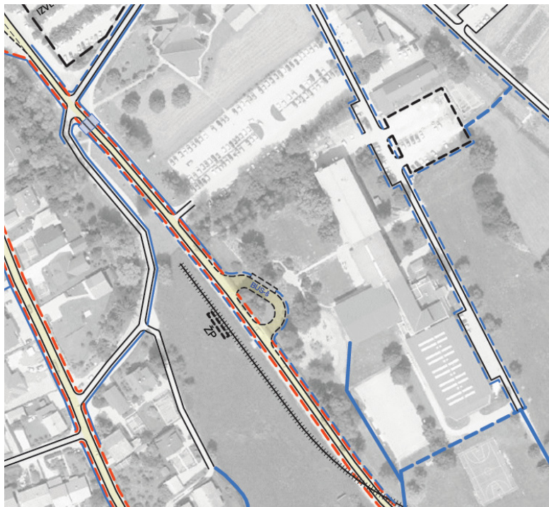
Detajl ureditve avtobusnega postajališča pri OŠ iz Zasnove urejanja prometa v Zrečah