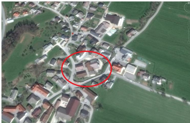
Slika 1: Lokacija kmetijskega gospodarstva Logar v vasi Goriče

V strogem središču vasi Goriče se nahaja Kmetijsko gospodarstvo Logar, kjer ga na severu omejuje območje župne cerkve sv. Andreja, objekt krajevne skupnosti in sosednje kmetijsko gospodarstvo, na vseh ostalih straneh je omejeno z lokalno cestno infrastrukturo, kjer nima prostora za širjenje in uvajanje sodobnih tehnoloških postopkov na tej lokaciji, zato so lastniki v letu 2016 sprožili ustrezne postopke za pridobitev dokumentacije za selitev kmetijskega gospodarstva iz vasi.