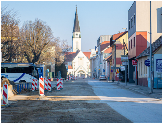
Dokončanje Slomškove ulice