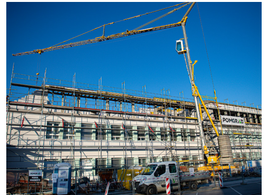
Nadzidava zdravstvenega doma