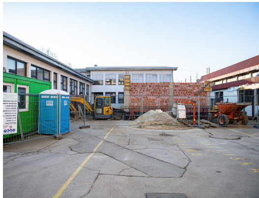
Dograditev učilnic na OŠ IV