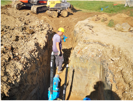
Izgradnja Vodovoda sistema B