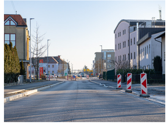
Dokončanje Gregorčičeve ulice