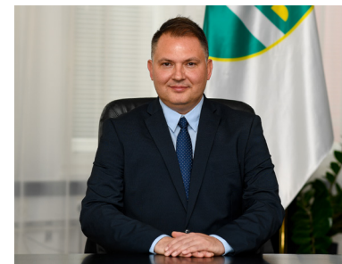
Damjan Anželj, župan

Zavedam se, da se je pri sestavi proračuna potrebno odločati med razpoložljivimi sredstvi in prioritetami ter verjamem, da nam bo s konstruktivnim sodelovanjem uspelo sprejeti najpomembnejši dokument občine. Tako bomo imeli izhodišče za nadaljnje ustvarjanje dobrih pogojev za razvoj ter višjo kakovost življenja naših občank in občanov.