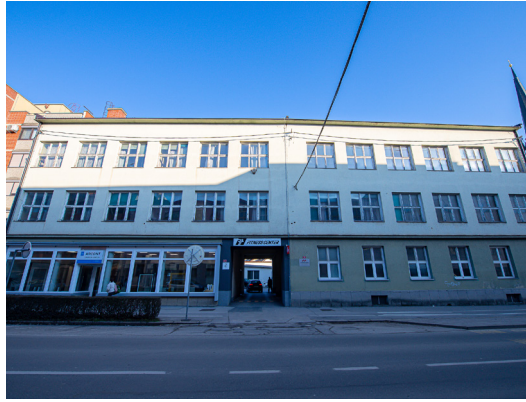
Ureditev 15 stanovanj za mlade