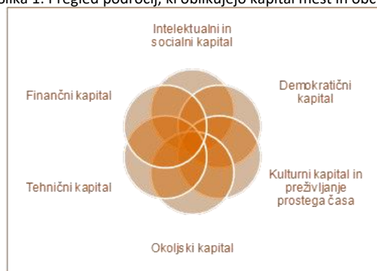
Slika 1: Pregled področij, ki oblikujejo kapital mest in občin

Za določitev smeri razvoja je pomembno razumevanje stanja razvitosti posameznih področij in izzivov, s katerimi se srečujemo.