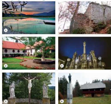
1 Vodni park Radlje ob Dravi / Radlje ob Dravi Water Park 2 Drava Mahlenberg / Mahlenberg Water Tower 3 Ravinja / Ravinja 4 Kamenito steno Mahlenberg / Base of the Mahlenberg castle 5 Soba za Miklavža in Maribor / Miklavž's room in Maribor 6 Soba za Miklavža in Maribor / Miklavž's room in Maribor 7 Miklavž's Church and 8 Črna in Bela Kapela / Black and White Chapel