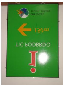
Info tabla – odnesel veter