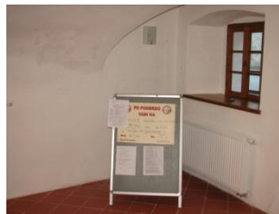
stojalo za obvestila – poškodovano, neuporabno, ker ga je »zbilo« tovorno vozilo