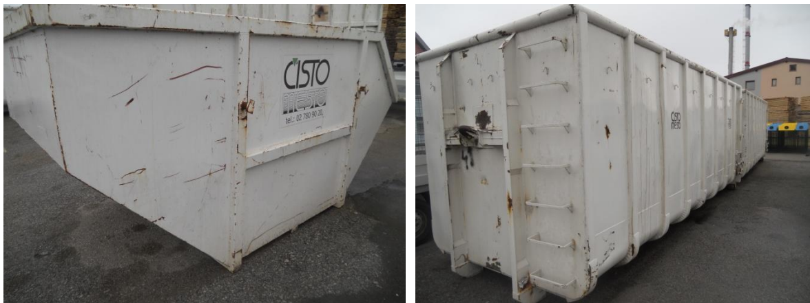
Fotografija 10 in 11: Kovinski kontejnerji