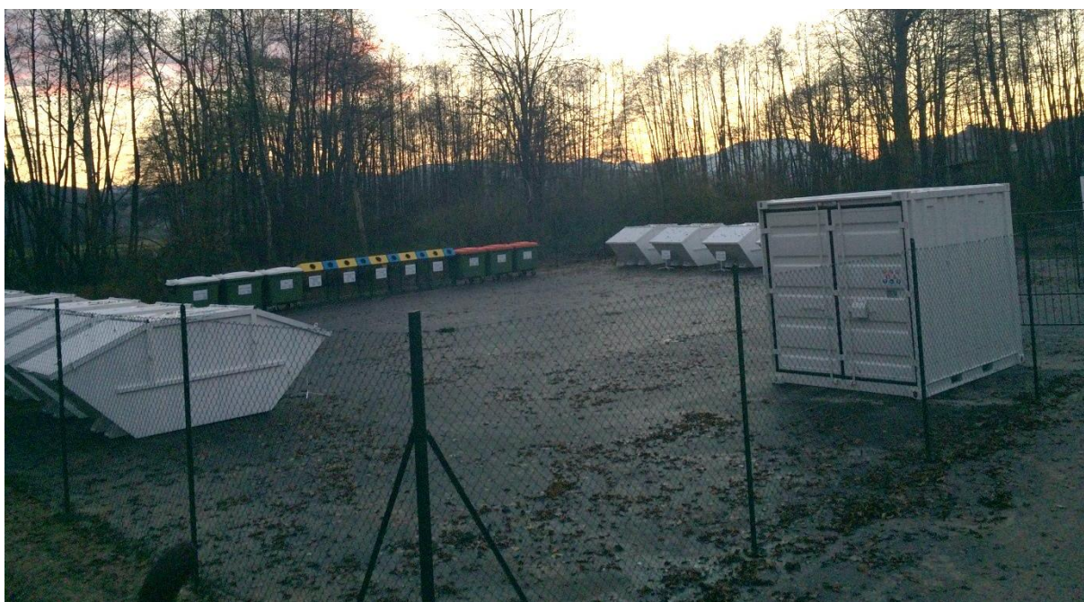
Fotografija 1: Primer zbirnega centra