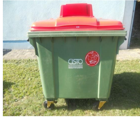
Fotografija 5 in 6: Posode za zbiranje papirja

Za zbiranje plastične embalaže ter ločenih frakcij iz plastike bomo uporabljali: