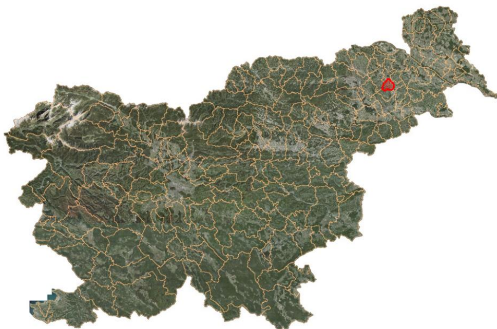
Slika 2: Lega občine Trnovska vas