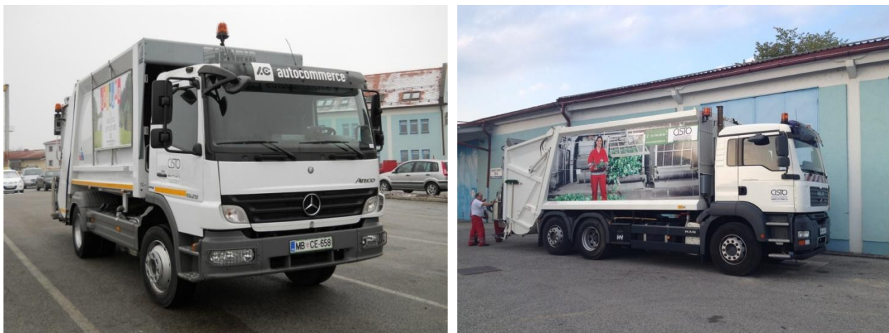
Fotografija 12 in 13: Smetarska vozila

Za zbiranje in prevoz komunalnih odpadkov na prevzemnih mestih pri povzročiteljih (Mešani komunalni odpadki, papir, mešana embalaža, biološki odpadki) in na skupnih zbirnih lokacijah (steklena embalaža) uporabljamo specialna komunalna vozila: