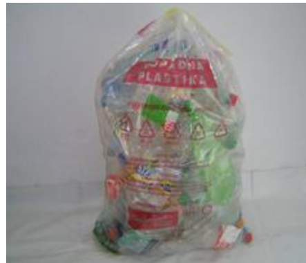
Fotografija 7: Vrečka za mešano embalažo

Za zbiranje steklene embalaže, ki poteka preko zbiralnic ločenih frakcij uporabljamo plastične zabojnike, volumnov 240 l in 1100 l in sicer: